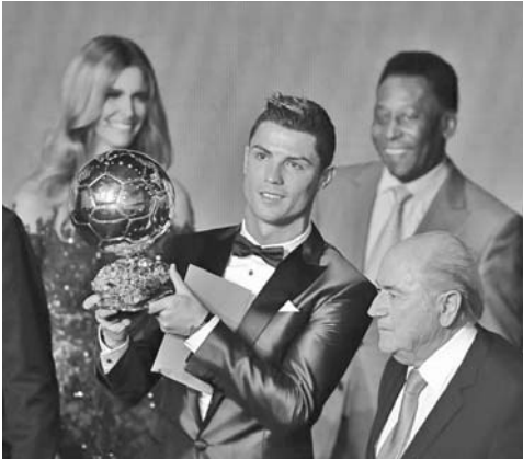
Ronaldo homenajeó a su coterráneo Eusebio y a Mandela.

Minutos antes, la portera alemana Nadine Angerer conquistó el galardón a la mejor futbolista del año entre las mujeres, delante de la brasileña Marta Araújo y la estadounidense