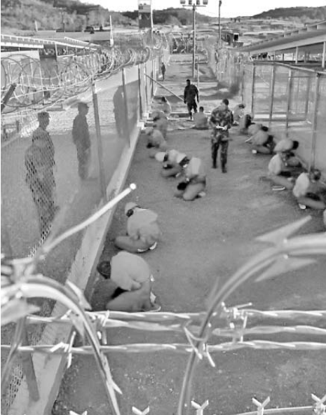
Detenidos en un área de espera mientras son custodiados por la policía militar en Camp X-Ray, en la cárcel de la base, el 11 de enero del 2002.

WASHINGTON.—El mayor general Michael Lehnert, oficial en retiro de las fuerzas armadas estadounidenses, pidió este lunes el cierre inmediato de la cárcel norteamericana en la ilegalmente ocupada base naval de Guantánamo. Lehnert fue el primer jefe del centro de internamiento para acusados de terrorismo inaugurado en enero del 2002 en esa instalación militar, reporta PL. “Es hora de cerrar la prisión para cumplir las leyes domésticas e internacionales, la Constitución estadounidense y velar por el respeto a los derechos humanos”, señaló el exgeneral de la infantería de marina. “Creo que hicimos un mal trabajo desde el principio al determinar a quién enviar a Guantánamo, principalmente en los primeros días de la existencia de la cárcel, y la mayoría de los prisioneros nunca debieron estar allí”, agregó. El exmilitar criticó el funcionamiento de las comisiones militares que juzgan a los presos en ese centro penitenciario, y señaló que los procesos pueden realizarse en los tribunales estadounidenses, según un artículo publicado este lunes por el diario digital Stars and Stripes. Tras asumir su primer mandato en el 2009, el presidente Barack Obama firmó una orden ejecutiva para cerrar la prisión de Guantánamo