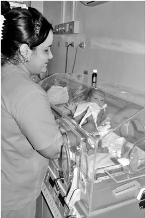
La interrelación lograda entre los diferentes servicios es considerada como decisiva para la consecución de los resultados del pasado año en Sancti Spíritus.

“Reconocimientos especiales merecen las salas de terapia intensiva para niños, y entre estas, las de los hospitales Fe del Valle, de Manzanillo, y General Milanés, de Bayamo; que de 13 y 9 fallecimientos en el 2012, respectivamente, ambas bajaron a seis en el año concluido.