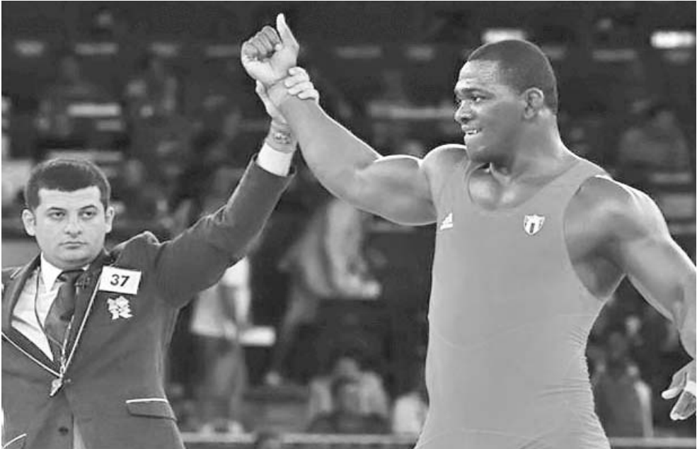
Mijaín reapareció con éxito en su nueva división de los 130 kilogramos.

En la edición precedente el ganador fue el fenómeno noruego Magnus Carlsen, campeón mundial, quien completó diez puntos de 13 posibles y superó a Aronian (8,5) y al indio Viswanathan Anand (8). (H. I. M.)