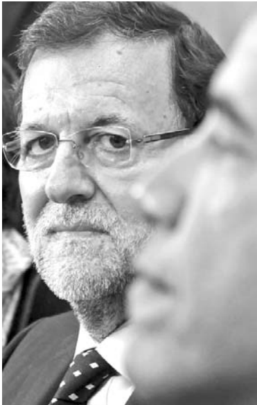
El espionaje y la economía centraron la visita de Rajoy a Estados Unidos.

Refiere DPA que las negociaciones en marcha para lograr un acuerdo de