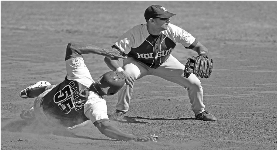
Holguín e Industriales, uno de los cuatro juegos iniciales de la segunda etapa.