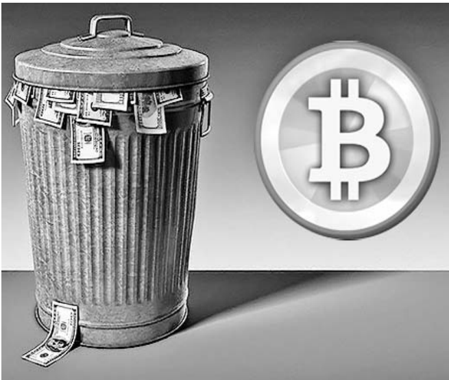
El Bitcoin, una moneda descentralizada en Internet, es una de las futuras opciones para sustituir al dólar como divisa internacional.

Aunque han surgido algunas alternativas como el euro en el Viejo Continente, que en sus inicios dio una dura pelea al dólar, la moneda norteamericana continúa siendo la principal divisa en el comercio mundial y de reserva.