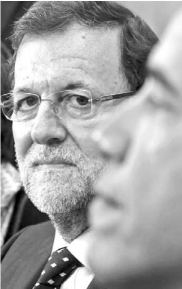
El espionaje y la economía centraron la visita de Rajoy a Estados Unidos.

Refiere DPA que las negociaciones en marcha para lograr un acuerdo de