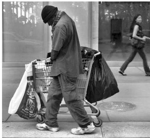
En las principales urbes estadounidenses existen grandes núcleos de pobreza.

“En la nación más rica de la Tierra, hay demasiados niños que nacen en la pobreza, muy pocos tienen una oportunidad justa para escapar de ella”, dijo este miércoles en un comunicado emitido con motivo del aniversario del discurso de Johnson.