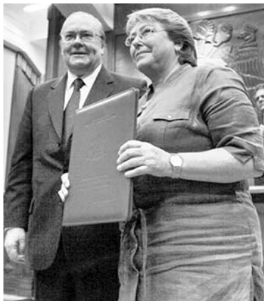
Bachelet presidirá Chile en el periodo 2014-2018.

“Estamos con ganas, con energía, con entusiasmo y mientras tanto estamos preparándonos para comenzar nuestra labor”, subrayó