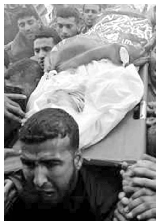
El año pasado, los asesinatos de palestinos se triplicaron en relación con el 2012.

Otra arista de la agresividad de Tel Aviv en los territorios que ocupa desde 1967 se manifestó en la cuestión de las casas demolidas en la Ribera Occidental y los desplazamientos forzados de seres humanos provocados por tales prácticas. (PL)