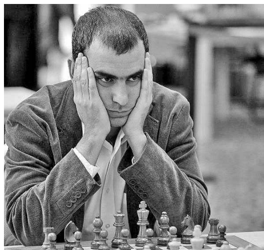
Leinier Domínguez.

Integran también el top-ten el ruso Vladimir Kramnik (2 787), el búlgaro Veselin Topalov (2 785), el italiano Fabiano Caruana (2 782) y el ruso Alexander Grischuk (2 777), del tres al siete por ese orden. Completan la privilegiada lista el israelí Boris Gelfand (2 777), el indio Viswanathan Anand (2 773) y el ruso Sergey Karjakin (2 759).