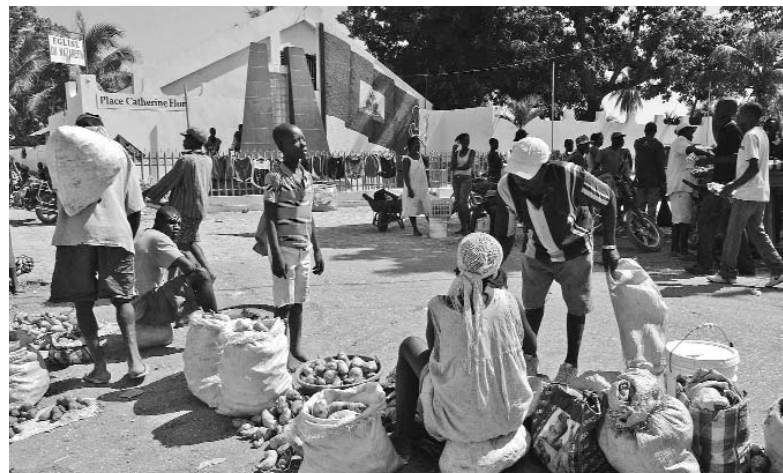
A más de dos siglos de su independencia Haití es uno de los países más pobres de América Latina.

Con una sorprendente historia de liberación y una amplísima y rica