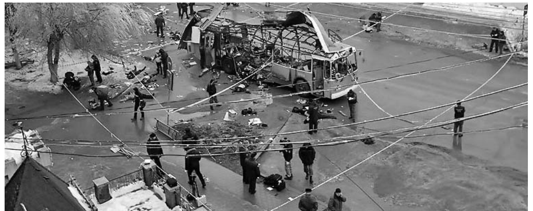
La carga explosiva se ubicó en el sistema de transporte local conocido como trolebus.