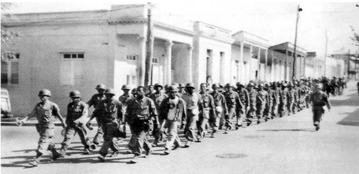
Rendición de los guardias de la tiranía en Palma Soriano, diciembre de 1958.

1 Todas las citas fueron tomadas del libro De la Sierra Maestra a Santiago de Cuba. La contraofensiva estratégica , Fidel Castro Ruz.