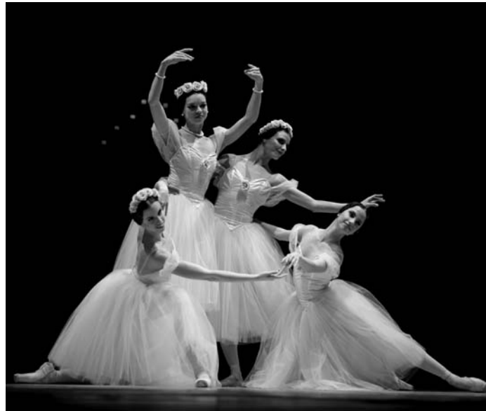
Grand pas de quatre.

Así fue la función. La magia del ballet se hizo sobre el escenario cuando la música de Cesare Pugni anunciaba el famoso Grand pas de quatre , con coreografía de Alicia Alonso sobre la original de Jules Perrot. Siempre, la pieza nos acerca nombres de otros tiempos, pero ahora fue una realidad con las “joyas”