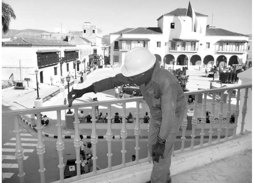
Intensas han sido las labores para devolverle su esplendor al Ayuntamiento.

Es cierto, después de Sandy aún hay muchas casas por levantar y techos por reponer todavía. A un ritmo acelerado se construyen unas y reconstruyen otras; pero el santiaguero no descuida la historia suya, y a la par de las paredes y los techos, también restaura los muros que hablan del arrojo, la tradición, la hospitalidad, y el espíritu de sangre y plomo que lo hizo héroe, a él, y al Santiago de toda Cuba.