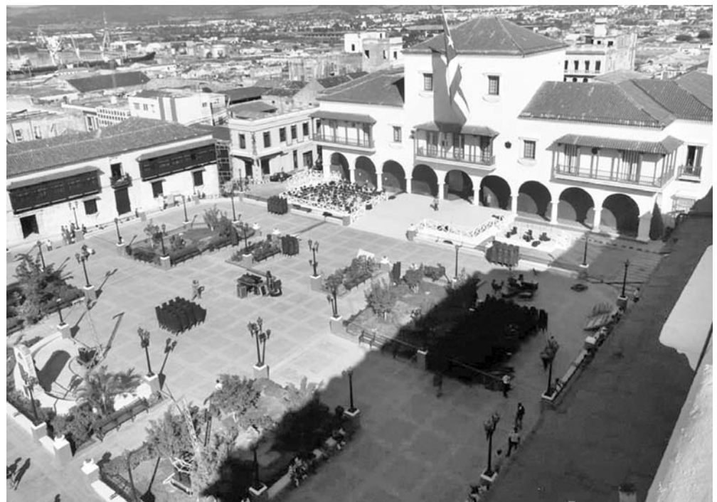
Una vista general de la plaza Carlos Manuel de Céspedes.