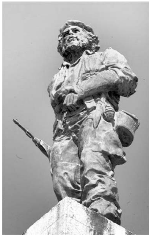
El Complejo Escultórico ha acogido los principales acontecimientos de los últimos años en Villa Clara.

Luego se producirían otros tres arribos de