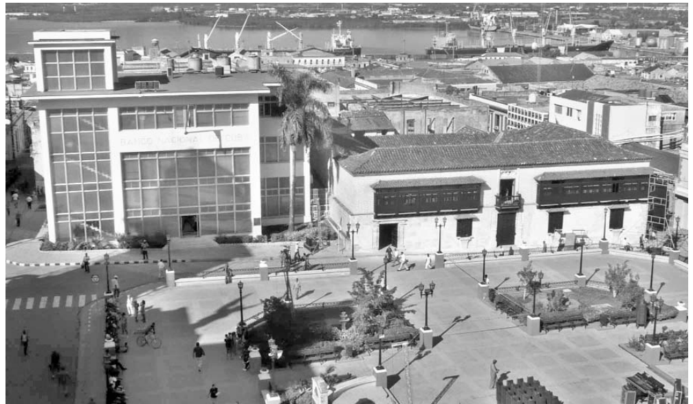
Dos edificaciones emblemáticas de la plaza: a la izquierda el edificio más moderno; a la derecha el más antiguo.