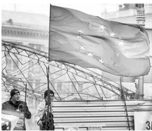
Los manifestantes pro-occidentales demandan en las calles un mayor acercamiento con la UE.

Sobre el propósito de las autoridades ucranianas de ingresar a la UE, Azarov insistió en que esa voluntad existe. Al abordar el posible Acuerdo de Asociación, pidió a quienes protestan en la Plaza de Independencia (Maidán) que pregunten si el pueblo está de acuerdo con el incremento del precio de los servicios públicos en caso de su firma. Los precios de las mercancías importadas se duplicarán, ya que una de las condiciones del FMI es una devaluación profunda del Grivna en