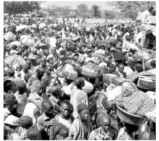
Cientos de personas de Sudán del Sur intentan huir de la violencia mientras esperan a las puertas del campamento de la Misión de Naciones Unidas en Bor, capital del estado de Jonglei.

aproximadamente 2 veces para adquirir dólares, resaltó. Además Azarov insistió en que los salarios y las pensiones se desvalorarán. Para que el sueño europeo se convierta en realidad hay que trabajar, concluyó Azarov. (PL)