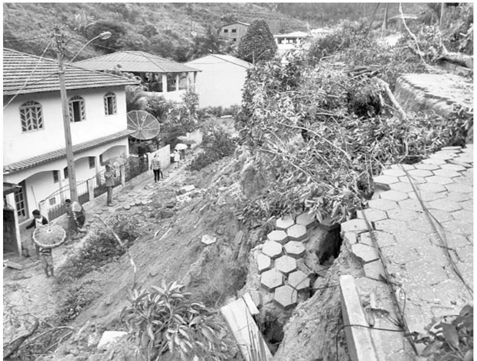
Las intensas lluvias han causado inundaciones y derrumbes en el sudeste brasileño.