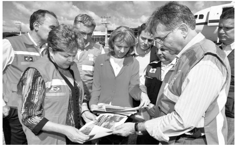
Autoridades estatales le explican a Rousseff los detalles de la situación.