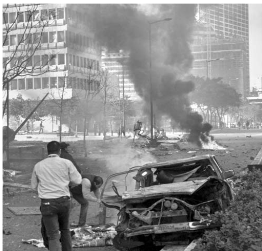
La explosión afectó varias cuerdas del centro de la ciudad.

LÍBANO.—Una fuerte explosión sacudió este viernes la capital libanesa de Beirut, causando la muerte de al menos cinco personas —entre ellas el exministro de Finanzas, Mohammed Shattah— y más de 70 heridos.