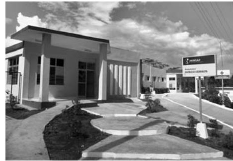
Vista parcial del policlínico.

El laboratorio Tecno SUMA posibilita la realización de diversos exámenes, como el de VIH, de próstata (PSA), alfafetoproteína,