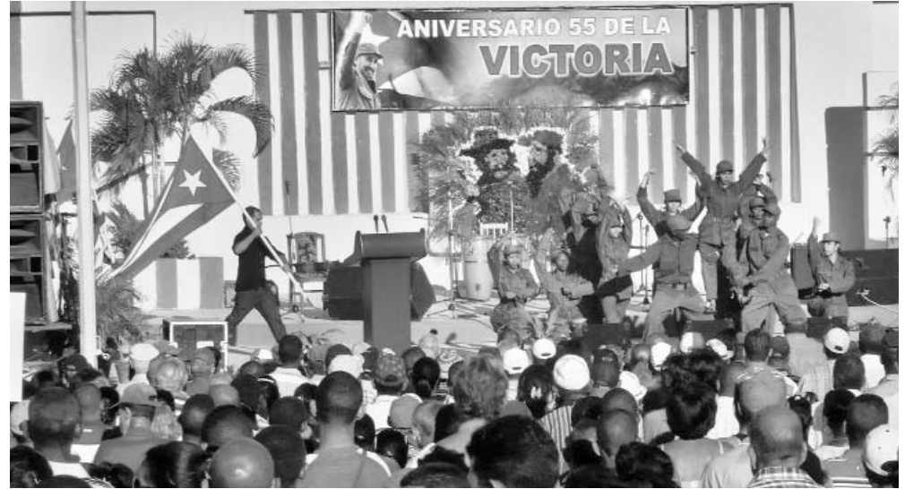
Miles de personas celebraron el aniversario 55 de la liberación de Palma Soriano.