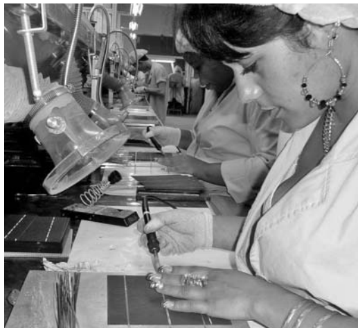
Para el 2014 está prevista la mejora de parte del equipamiento, en busca de mayor eficiencia y de elevar los controles de calidad.

No obstante, señaló que los paneles salidos de esta industria también se han utilizado en otro