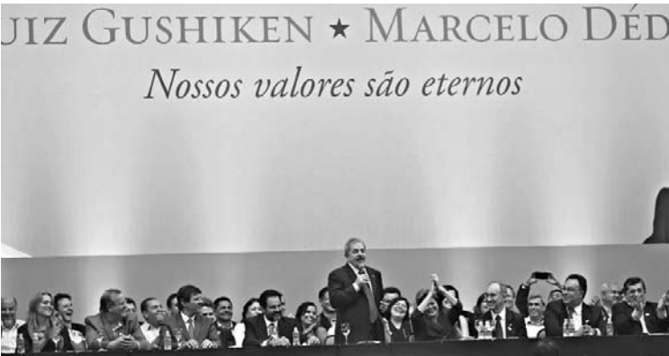
Momentos del V Congreso del PT.

BRASILIA.—El Partido de los Trabajadores (PT) reclamó el jueves en la inauguración de su V Congreso que la presidenta brasileña, Dilma Rousseff, sea su candidata para los comicios del 2014, según PL.