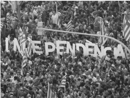
Durante el último año han ocurrido numerosas manifestaciones independentistas en esa Comunidad Autónoma.

Cataluña, una región de 7,5 millones de habitantes y uno de los motores económicos de la nación ibérica, pasa por un mal momento económico con altísimas deudas públicas y desde hace un año la crisis económica ha atizado los históricos sentimientos independentistas de la Comunidad Autónoma.