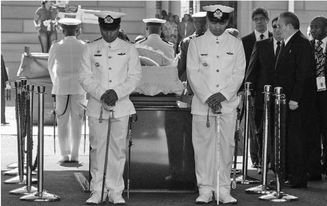
El Presidente cubano rindió tributo a Mandela en el Union Building, la sede del Gobierno de Sudáfrica en Pretoria.

ÓRGANO OFICIAL DEL COMITÉ CENTRAL DEL PARTIDO COMUNISTA DE CUBA