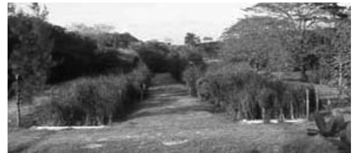
Humedal artificial en el barrio obrero Pogolotti, municipio de Marianao, en La Habana.