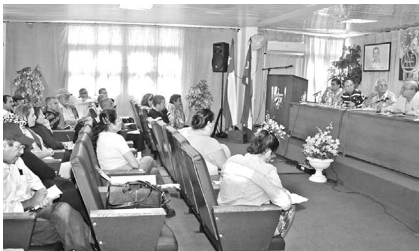
Promover lo mejor de la cultura fue el llamado de los artemiseños.

Además, se planteó la necesidad de concebir encuentros periódicos para analizar las dificultades que los afectan, así como de velar por la calidad de cada propuesta, rescatar