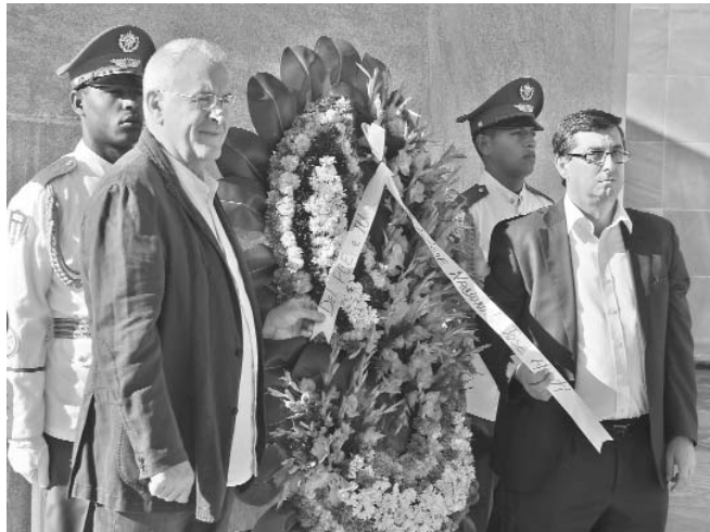
Los visitantes colocaron una ofrenda floral en el monumento a José Martí en la Plaza de la Revolución.

Finalmente, Centella aprovechó la oportunidad para reclamar la libertad de los