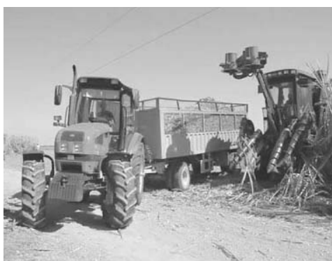
Corte mecanizado en áreas del central Uruguay.