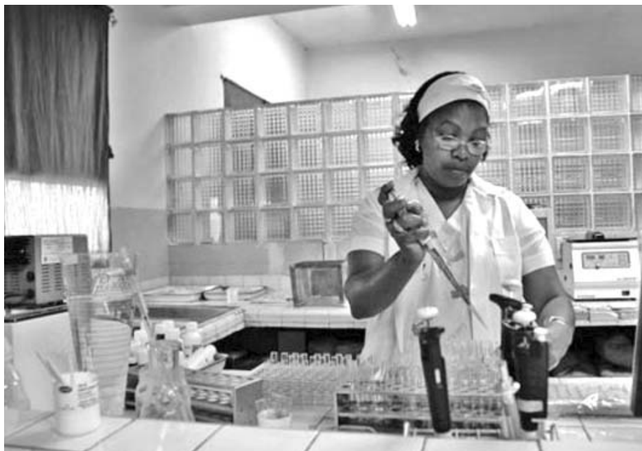
Los niños, desde el nacimiento, tienen garantizadas las atenciones médica, dietética y farmacológica.