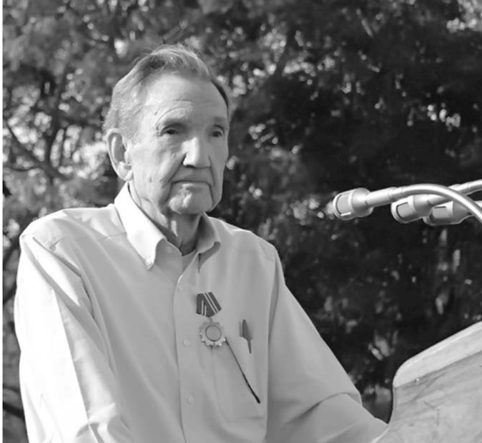
Ramsey Clark recibió recientemente en Holguín la Orden de la Solidaridad del Consejo de Estado de la República de Cuba, la cual fue entregada por familiares de los Cinco.

norteamericanas, ¿qué cree del juicio de los Cinco en Miami?