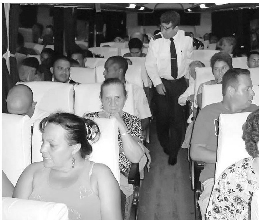
Así suelen salir los ómnibus desde la Terminal, pero al regreso...

La causa de aquella visible contrariedad yacía dentro del estuche de tela que habitualmente tiene cada asiento en su parte posterior: algún indolente había vertido vómito allí el día antes. Cansados de hurgar desde la víspera en todos los rincones y espacios interiores, por fin se produjo el hallazgo o confirmación de un hecho tan insólito como inaceptable.