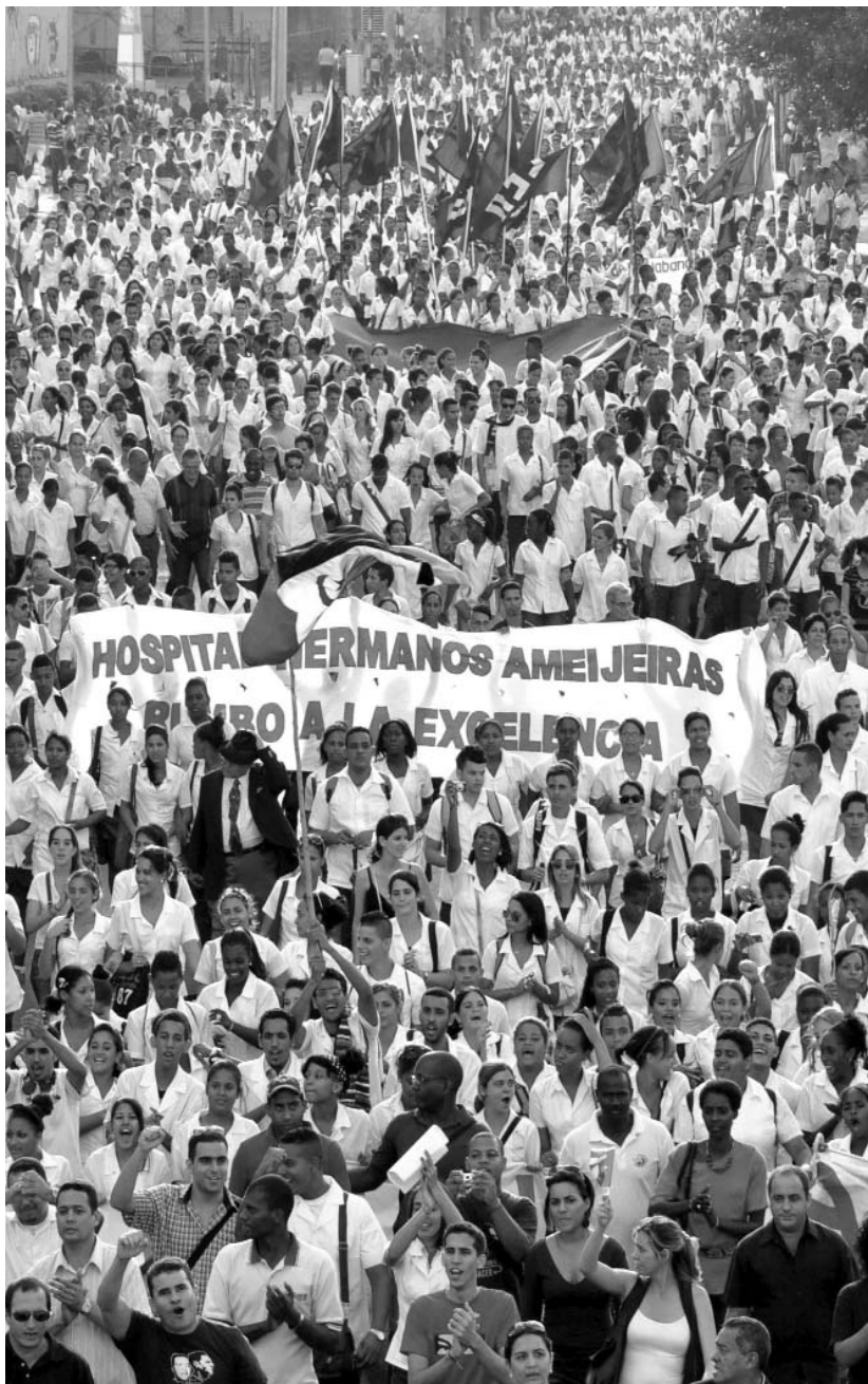
En cuadro apretado, universitarios y estudiantes de la enseñanza media, recorrieron toda la calle San Lázaro hasta llegar al Monumento a los Mártires en la explanada de La Punta.

En la esquina de Morro y Colón, en La Habana Vieja, cerca del lugar