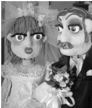
Personajes de la obra.

La versión, escrita por Erduyn Maza, se basa en el clásico de Federico García Lorca, Amor de don Perlimplín con Belisa en su jardín . La adaptación a la contemporaneidad del texto lorquiano perpetúa el