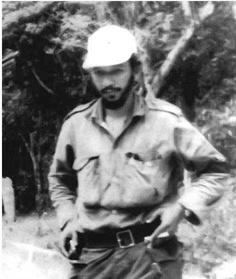
Braulio Coroneaux, héroe de la Batalla de Guisa.

Una y otra vez rechazaba al enemigo. Ya es clásica su respuesta al líder de la batalla: “¡Descuide, Comandante, por aquí no pasarán!”. Y,