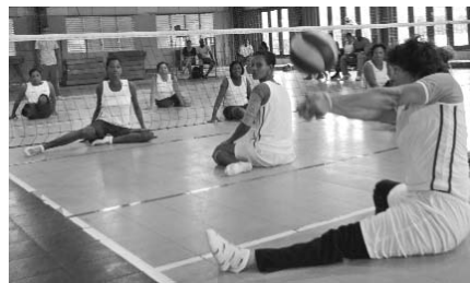
Discapacidad no significa aislamiento social, estos miembros de la ACLIFIM lo demuestran concurrendo a un partido de voleibol sentado.

El programa comprende, entre otras actividades, conferencias, un curso