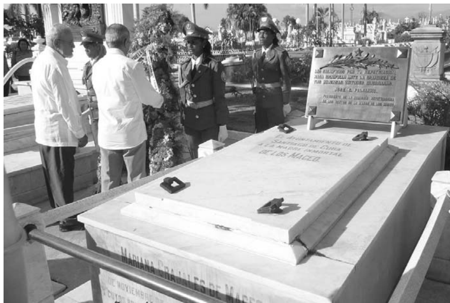
José Ramón Balaguer y Jorge Risquet, encabezaron el homenaje a Mariana Grajales.