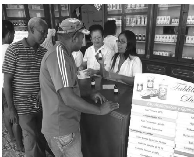
Una amplia gama de formulaciones predominan en la remozada red de farmacias de la provincia.

Además, ponderó los resultados de los cuatro centros de