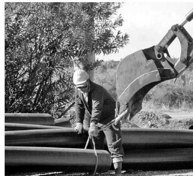
El programa integral de rehabilitación hidráulica de Trinidad beneficiará a miles de personas.