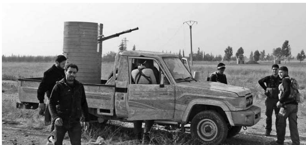
Las bandas armadas no han logrado unificarse para asistir a Ginebra II.

Pero la pérdida de vidas y los daños materiales son tantos que hoy el estado árabe