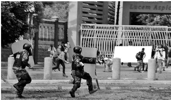
El Ejército utilizó gases lacrimógenos para dispersar a los estudiantes.

El Canal Educativo retransmitirá este programa al final de su emisión del día.