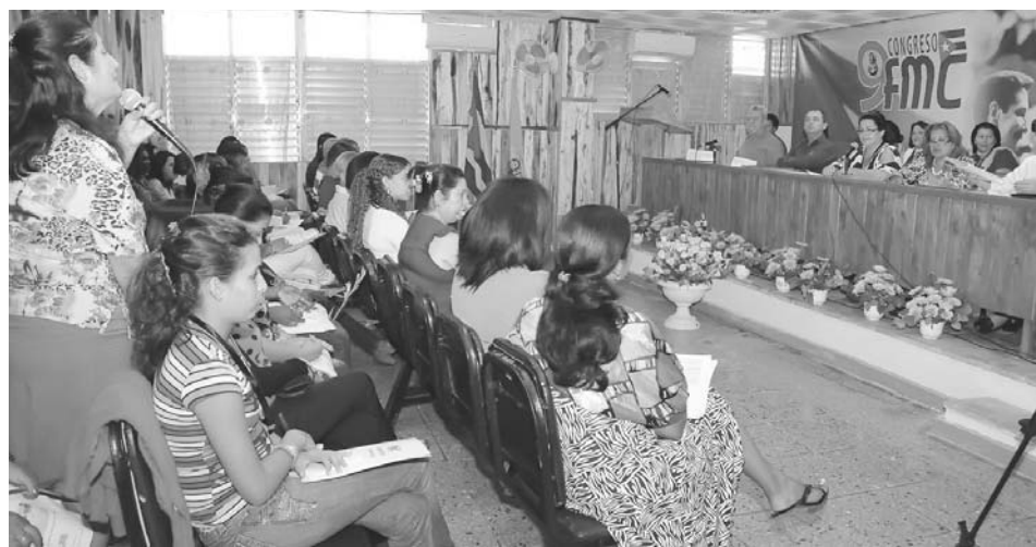
Las federadas de Artemisa reflexionaron sobre el papel de la mujer en la actualización del modelo económico.