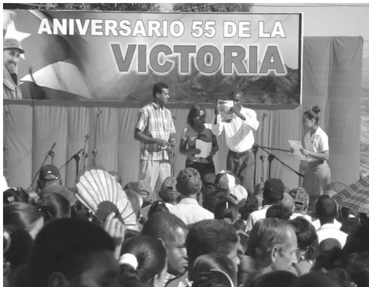
Organismos e instituciones recibieron reconocimientos por sus destacados resultados.

En presencia de Lázaro Expósito Canto, miembro del Comité Central del Partido y primer