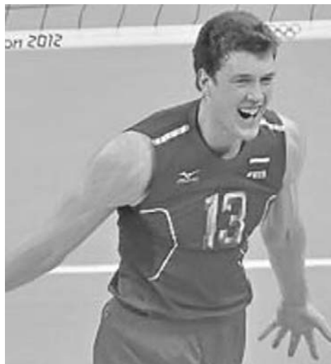
Dmitriy Muserskiy fue el Jugador Más Valioso en la Copa de Grandes Campeones.

Este partido, que cerró la temporada internacional del voleibol, constituyó el número 60 en la historia de los enfrentamientos entre ambos equipos, ahora con balance de 32 triunfos para Brasil y 28 a la cuenta de sus oponentes, ventaja que se ha ido cerrando en este 2013 y nos asegura que, a unos meses del Campeonato Mundial 2014, la porfía entre estos colosos cobra interés.