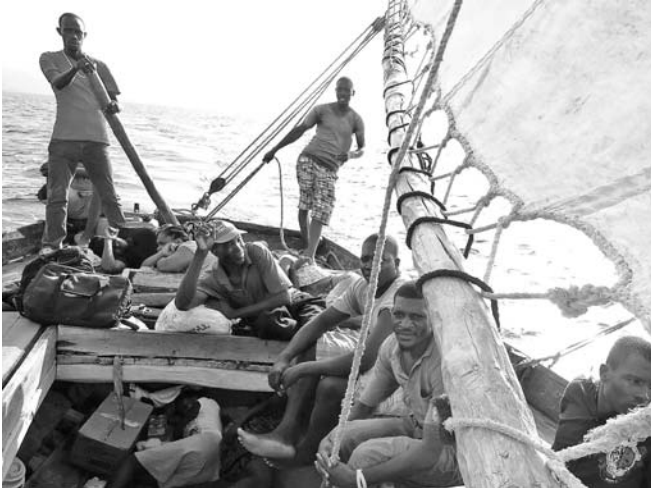
Barco velero camino a la Isla.