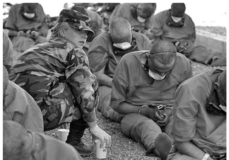
Cientos de prisioneros han sido sometidos a graves violaciones de los derechos humanos en la cárcel ubicada en la ilegal base naval norteamericana en Guantánamo.

Por su parte, el embajador brasileño, Antonio Patriota, celebró que la lista de copatrocinadores de la resolución haya aumentado considerablemente lo cual, según destacó, indica "claramente" la importancia que dan los ciudadanos del mundo a este tema.