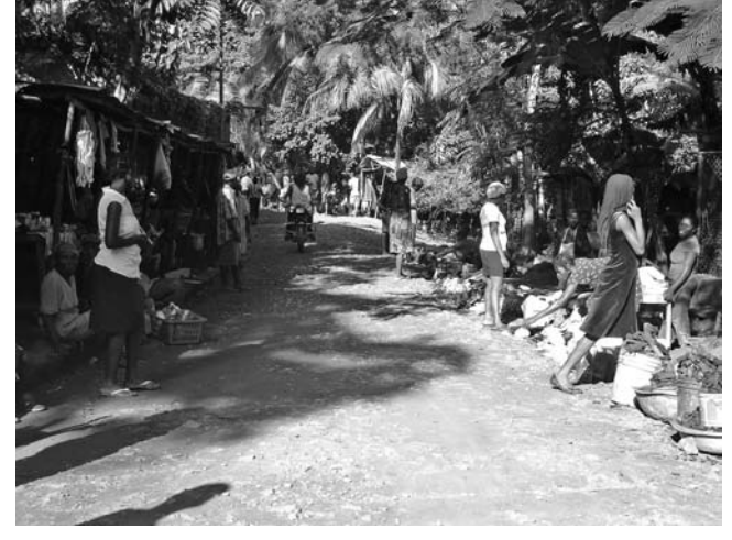
Interior de la Isla.