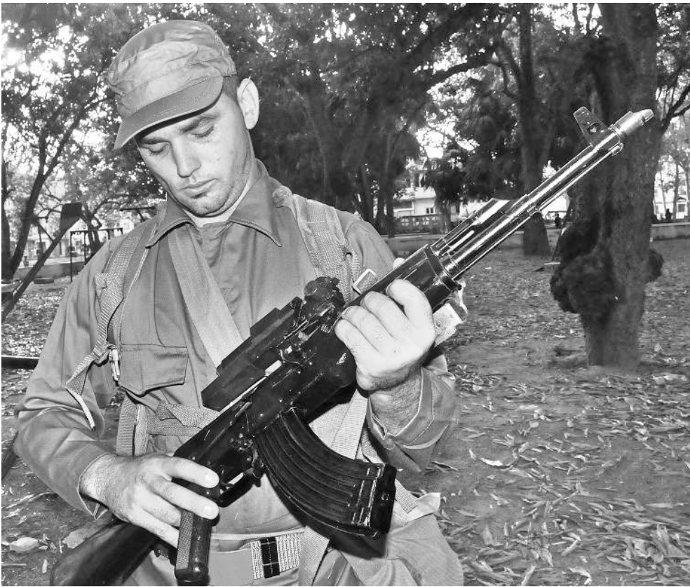
Los movilizados revisan el armamento momentos antes de salir a cumplir misión.