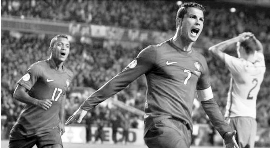
El astro luso Cristiano Ronaldo se erigió nuevamente en genio y figura, con un hat trick ante Suecia.

Así pues, el sorteo final para la vigésima edición del torneo se realizará el próximo 6 de diciembre en Salvador de Bahía, donde el equipo anfitrión arrancará ubicado en el grupo A.