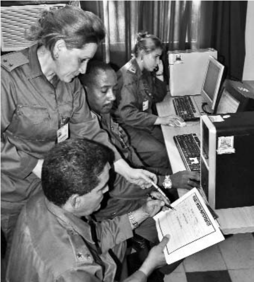
En los diferentes grupos de trabajo estaban creadas las condiciones para dar cumplimiento al inicio del ejercicio.

Esta aseveración se confirma en lo expresado por el Líder histórico de la Revolución Cubana, Fidel Castro Ruz, en la Tribuna Antimperialista José Martí en el 2004: “En cada jefe político y militar de cualquier nivel, en cada soldado individual, hay un comandante en jefe potencial que sabe lo que debe hacer, y en determinada situación cada hombre puede llegar a ser su propio comandante en jefe”.