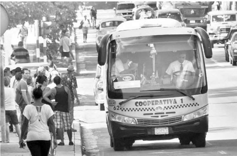
La incorporación de dos cooperativas con los taxis ruterios arrendados por el Estado, incrementó el número de pasajeros transportados en la capital.

Predicciones sobre el cambio climático destacan, entre sus efectos potenciales, el aumento de la variabilidad espacio-temporal de precipitaciones, con presencia de inundaciones y sequía; ello influiría en el manejo, la disponibilidad, y la calidad del agua potable en Cuba, apuntó del Rosario. (AIN)