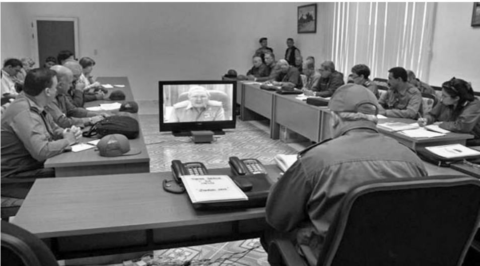
El Consejo de Defensa Provincial puntualiza las misiones.

“Tanto aquí, como en las unidades de combate, refiere el capitán, hay un cuerpo de oficiales preparados y leales, que son continuadores de la generación bravía que hizo la Revolución, la supo defender de múltiples agresiones y escribió páginas gloriosas en el cumplimiento de importantes misiones internacionales”.