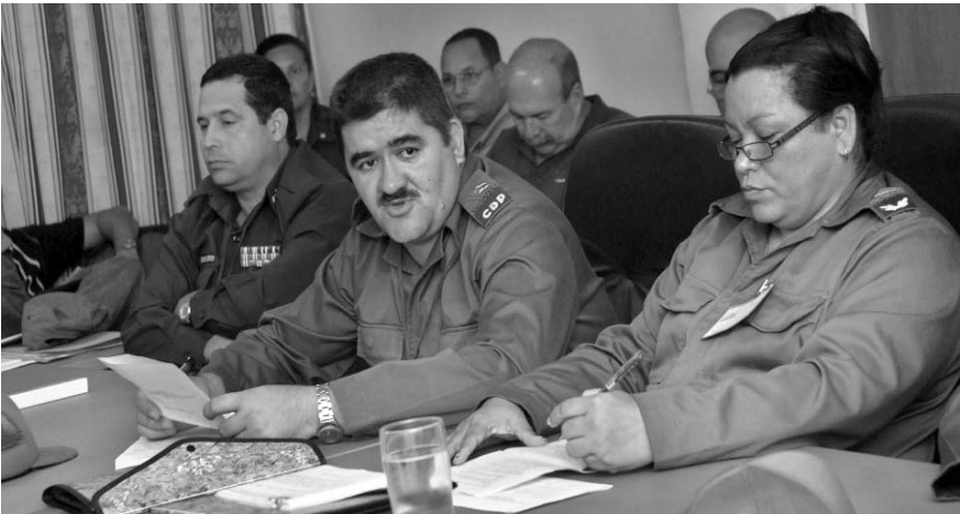
Activación del Consejo de Defensa Provincial, en Granma.

Pérez Mojena supervisó las medidas concretas e inmediatas que en el orden político e ideológico, de enfrentamiento y para el aseguramiento económico estaban previstas por los Grupos de