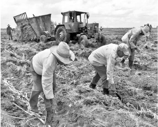
En la provincia continuará la siembra hasta cerrar el año.