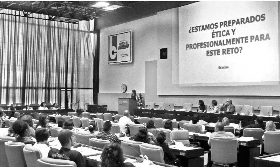
La preparación de los profesionales del sector jurídico también influye sobre la eficiencia de los procesos de contratación, coincidieron los participantes.