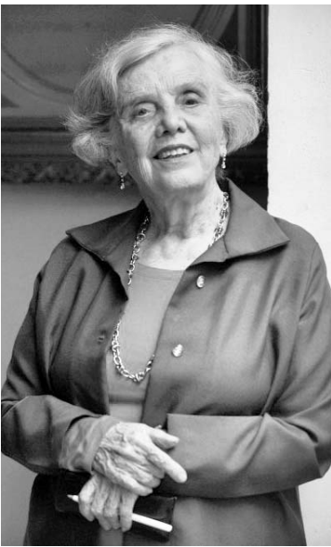
La escritora mexicana, de 81 años, es la cuarta mujer galardonada con el Cervantes desde su creación en 1975.