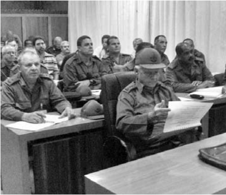
Jefes y oficiales en el inicio del Ejercicio Estratégico Bastión 2013.

La elevada preparación de los órganos de dirección y mando de las estructuras del Consejo de Defensa Provincial quedó demostrada durante la primera jornada del