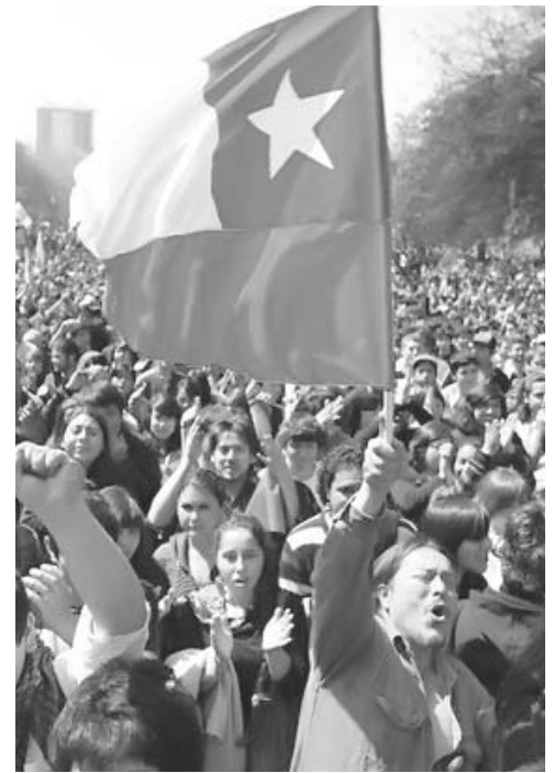
La próxima presidenta chilena tendrá que lidiar con las fuerzas sociales que han despertado en esa nación.

Acorde con los datos ofrecidos por el Servicio Electoral chileno, el pacto de centro izquierda representado por Bachelet, obtuvo