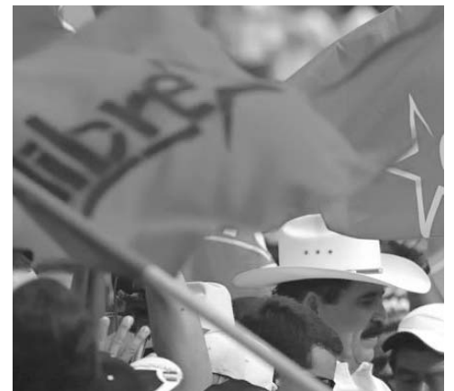
El depuesto mandatario Manuel Zelaya (al centro con sombrero blanco) asistió al cierre de campaña de su esposa, Xiomara Castro.

La USAID se autodefine como una organización no gubernamental, aunque es uno de los instrumentos de la Casa Blanca que utilizan los servicios de inteligencia para obtener información sobre países de la región e influir en su política interna y externa.