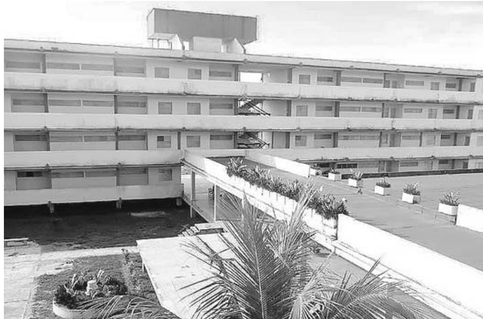
La mayoría de las 250 viviendas acondicionadas en las tres comunidades agrícolas de Vueltabajo permanecen vacías.

Sin dudas un serio obstáculo que no se valoró suficientemente a la hora de ubicar estos asentamientos, aun cuando la entrega de tierras no puede supeditarse a ello.