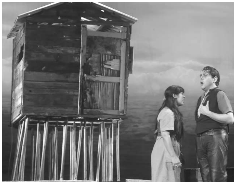
El Teatro Lírico Nacional estrenó, en la sala Avellaneda, una ópera de Wagner.