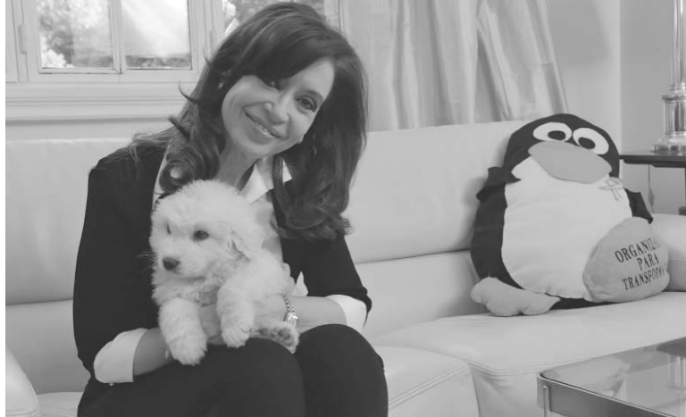
Cristina Fernández en su primera aparición pública luego de la cirugía a la que fue sometida.

"Ahora estamos trabajando, al frente y poniendo toda la buena voluntad", dijo Fernández, quien agradeció "a todos los que se preocuparon por mi salud, y en particular a los que la ayudaron en la enfermedad".