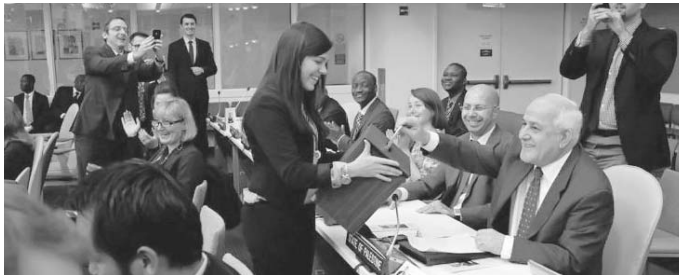
El Embajador palestino ante la ONU ejerciendo el histórico derecho al voto.

Reporta AFP que muchos de los 193 miembros de la asamblea aplaudieron de pie cuando Mansour emitió su voto.