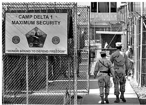
Durante el Seminario se exigió a Estados Unidos devolver a Cuba el territorio de la Base Naval de Guantánamo, usurpado hace un siglo y donde actualmente hay un centro ilegal de detenciones.

Entre otras numerosas personalidades que intervinieron en la primera jornada del Seminario estuvieron Williams Ransey Clark, exfiscal general de Estados Unidos y recientemente condecorado con la Orden de la Solidaridad que otorga el Consejo de Estado de la República de Cuba, y el Doctor en Ciencias Manuel Carbonell, profesor