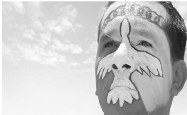
Desde hace más de medio siglo los colombianos no han vivido un solo día en paz.

Hoy se cumple un año de la apertura en La Habana de la mesa de conversaciones que busca poner fin al conflicto armado en Colombia