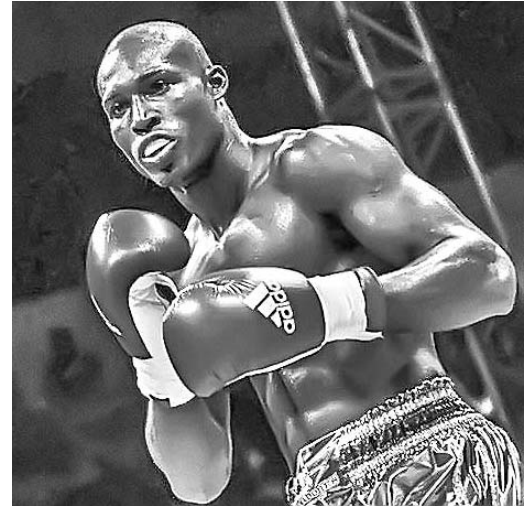
El bicampeón del orbe Julio César la Cruz (81 kg) será una de las principales cartas de los Domadores para este segundo tope.

De hecho, para esta segunda fecha, los rusos