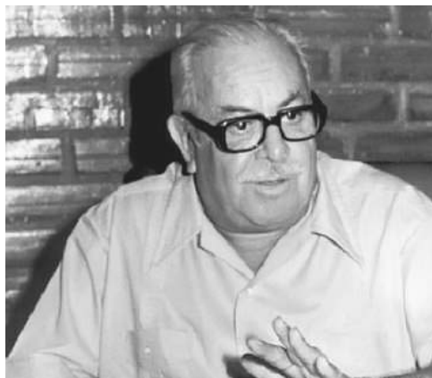
El intelectual guatemalteco Manuel Galich.

Pero en la institución de G, en el Vedado capitalino, el homenaje tendrá el viernes 22