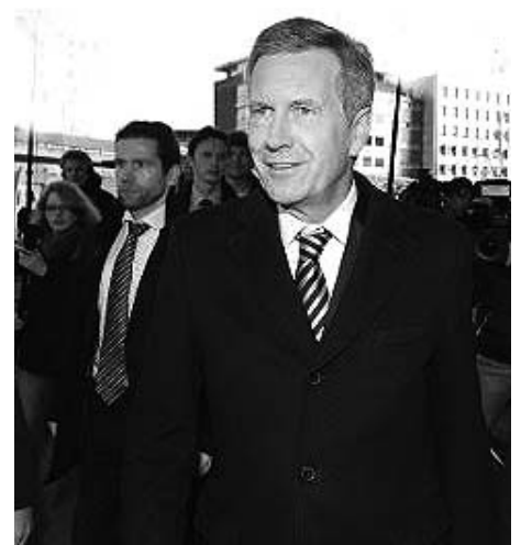
El expresidente alemán Christian Wulff.

Wulff decidió renunciar a la presidencia