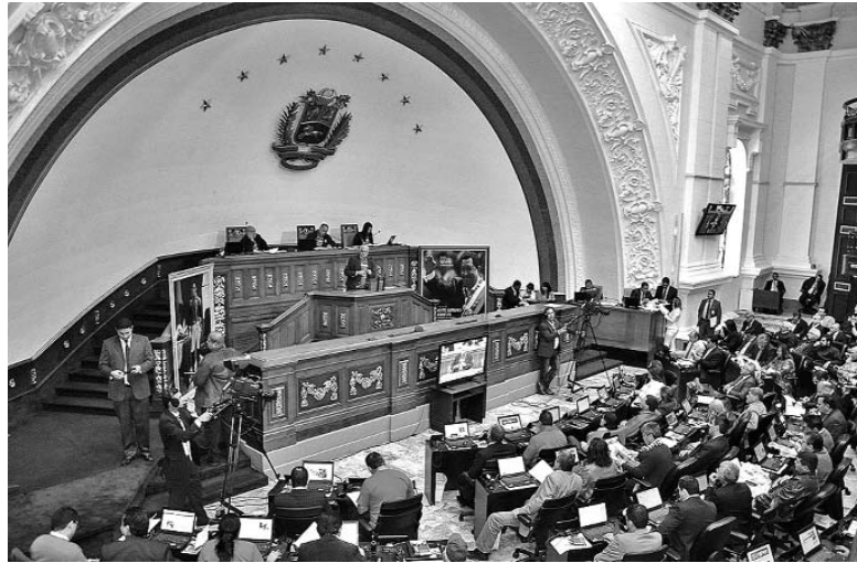
El Parlamento discutió la Ley en primera instancia.

Desde el estado Carabobo, Maduro aseguró que ahora la Ley Habilitante profundizará las acciones para proteger al pueblo de la guerra económica de la derecha: "Yo le digo al pueblo que ahora es que voy para adelante, con la Habilitante