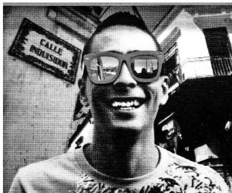
Do not cross, de Ernesto Javier Fernández.