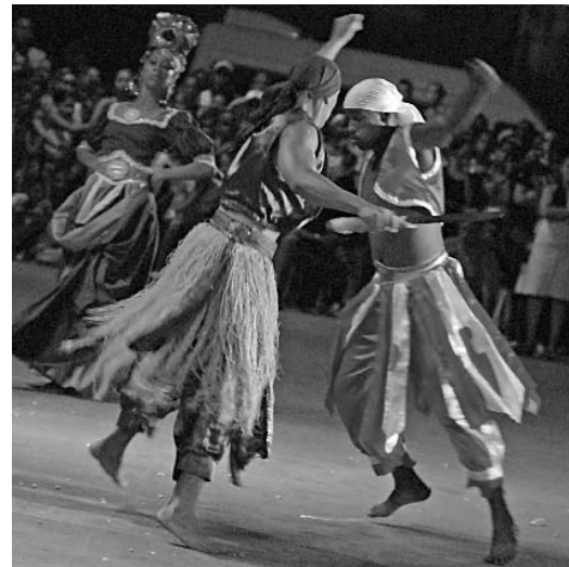
La danza y la música africana reinarán en el Wemilere.

Otras opciones serán la Feria El Diablito; el foro literario, que acogerá narraciones orales, poemas, cuentos, leyendas, patakíes y testimonios, en el Museo Casa de los Artistas; el Wemilere infantil; y en los barrios, talleres de danza; la puesta en escena de la obra Virginia y los Orishas , a cargo de Teatro de la Villa; exposiciones fotográficas; presentaciones