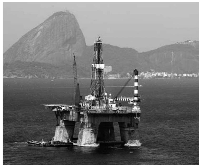
Los principales yacimientos de petróleo en Brasil están en aguas profundas.