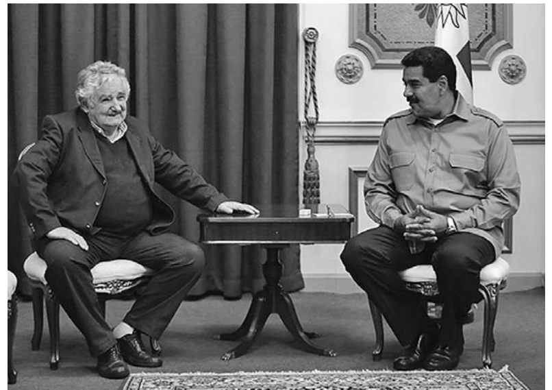
Maduro (derecha) junto al presidente de Uruguay, José Mujica.

Un total de 204 miembros titulares y 169 miembros alternos del Comité Central del PCCh asistieron a la sesión plenaria, que tuvo lugar a puertas cerradas entre el 9 y el 12 de noviembre en Beijing.