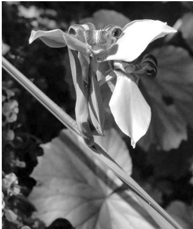
Amarillidaceae, nombre común Iris Amarillidaea o solo Iris.

Este jardín, el tercero en importancia del país, es atravesado por el río Cupaynicú, del cual toma su nombre,