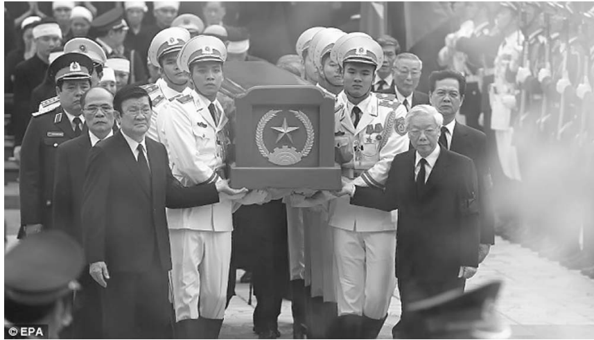
Dirigentes del Partido y el Estado vietnamitas encabezaron las ceremonias fúnebres del General Giap.

Desde Nicaragua, la coordinadora del Consejo de