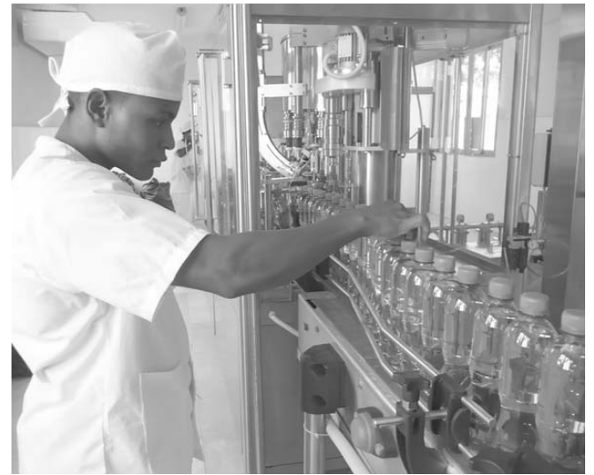
Trabajar con disciplina, eficiencia y cuidado del equipamiento es la meta de Norlen.

Los cursos programados para la jornada de hoy tratarán sobre Estrategias y proyectos para el desarrollo local; La relación ciencia-innovación tecnológica-desarrollo: la economía basada en el conocimiento; Temas actuales de la logística empresarial y Liderazgo e inteligencia emocional.