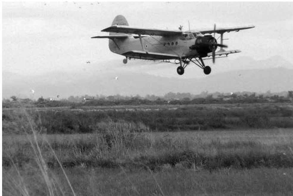
La falta de aviones ha impedido la aplicación a tiempo de los insumos en buena parte del macizo arrocero de Pinar del Río.