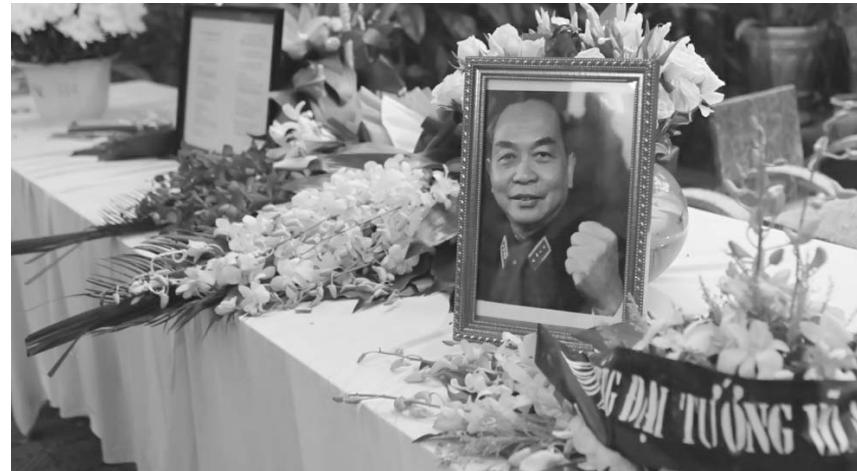
Los vietnamitas acudieron a cuarteles militares de todo el país para dedicar un último adiós al célebre militar.

Comunicación y Ciudadanía, Rosario Murillo, dijo que Giap fue “artífice de la victoria que le permitió al pueblo de Vietnam ponerse de pie y garantizar su territorio libre”.