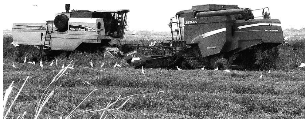
Como parte del programa de desarrollo arrocero se ha puesto a disposición de los productores un importante grupo de equipos, pero sin la aviación, su impacto es limitado.