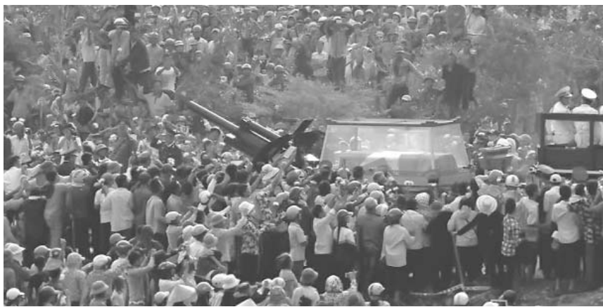
Decenas de miles de vietnamitas de todas las edades acompañaron la procesión.