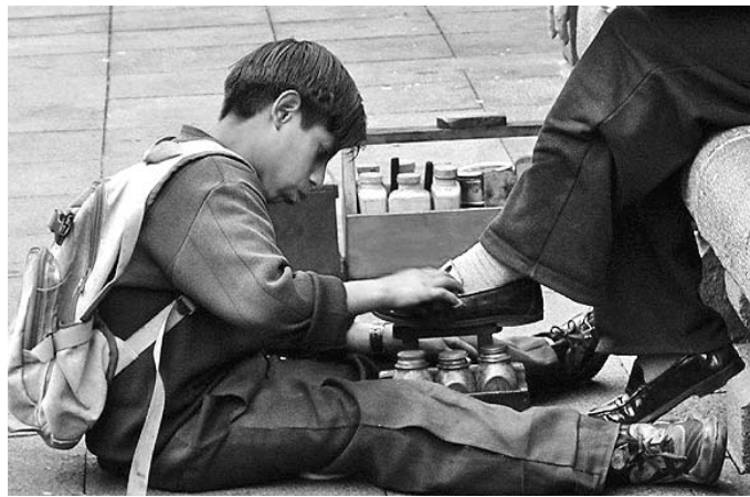
Unos 168 millones de niños trabajan en el mundo.

De acuerdo con el jefe del Gabinete de ministros, Juan Manuel Abal, "el equipo de la Presidenta está gobernando sin ningún tipo de sobresalto ni complicación. Es un equipo muy sólido. Las políticas de Gobierno las va a ejecutar su equipo de trabajo, encabezado por el Vicepresidente a cargo".