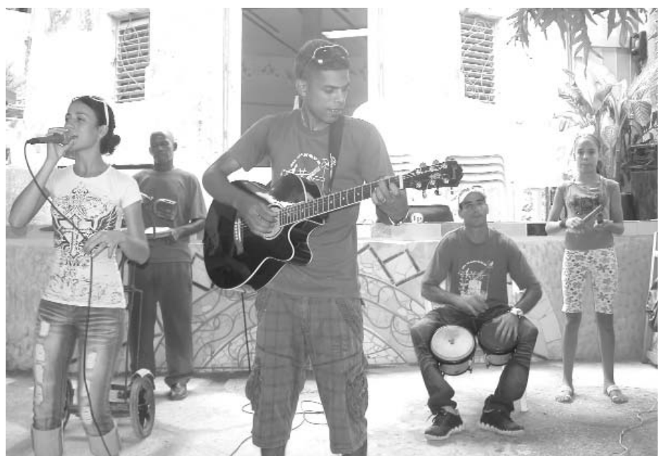
Integrantes de Muraleando animaron el encuentro.