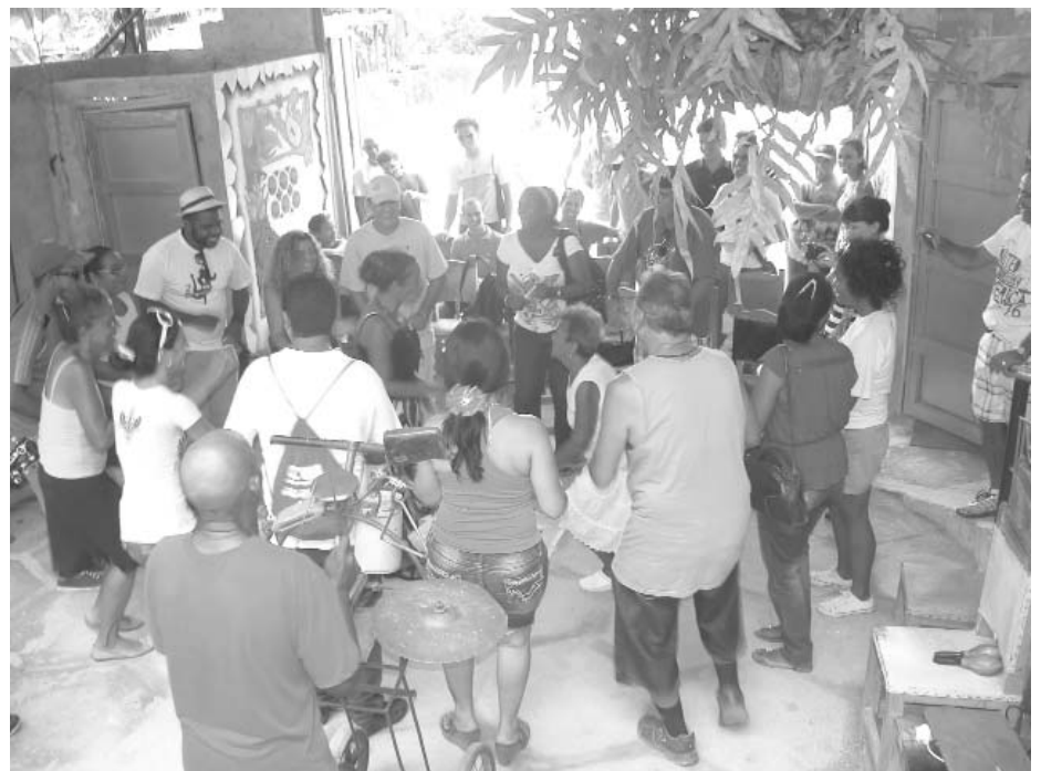
Jóvenes artistas visitaron el proyecto Muraleando e intercambiaron con habitantes de la comunidad.