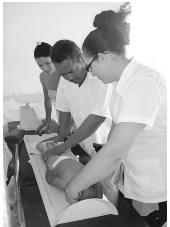
El nexo directo con la población es vital para los objetivos de la salud cubana.

En opinión de directivos y especialistas, de forma general prevalece entre esos jóvenes una buena preparación desde el punto de vista docente y profesional, tienen calidad humana y revolucionaria, varios de ellos acumulan determinada experiencia de dirección en organizaciones estudianti-