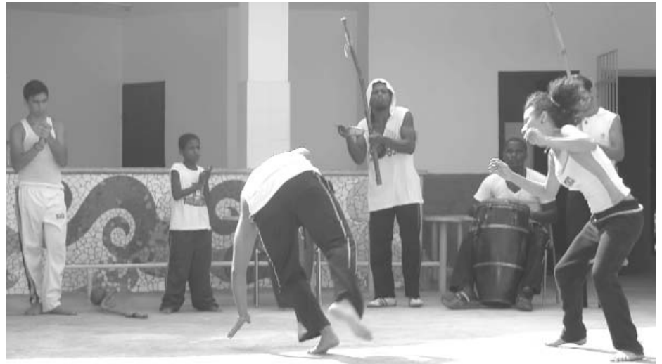
El grupo de Capoeira Macaco Ache atrajo el interés de los delegados.