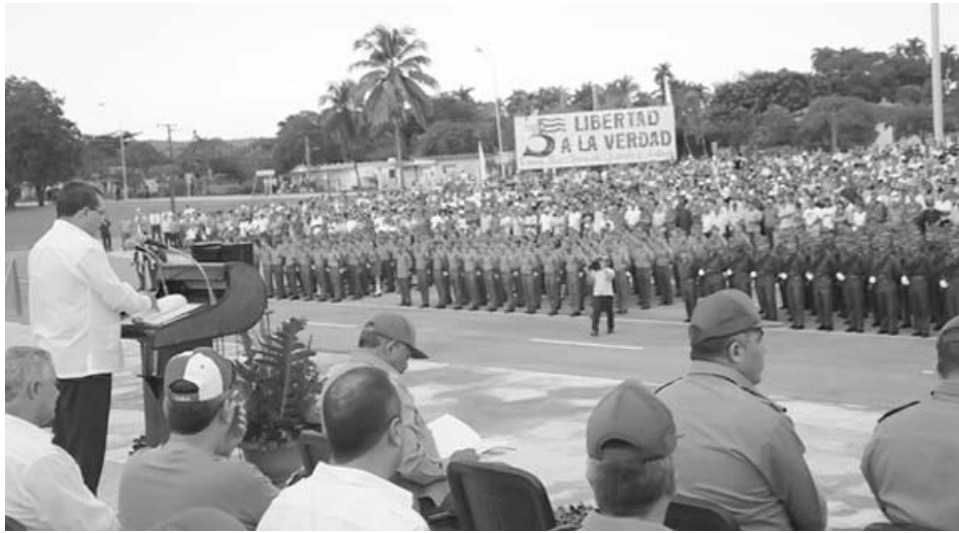
Monteagudo Ruiz destacó la proeza realizada por la Columna invasora.