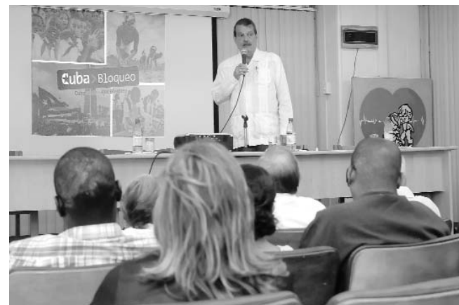
El viceministro cubano Abelardo Moreno presentó a la prensa el documento que se someterá a consideración de la ONU a finales de octubre.

A pesar de que el presidente Barack Obama prometió un nuevo comienzo en las relaciones con Cuba, cinco años después el bloqueo se ha mantenido intacto