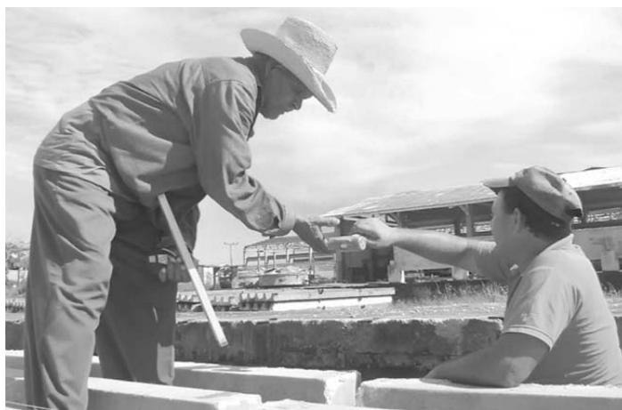
Las traviesas elaboradas en la fábrica Cuba 71, resultan de vital importancia para el desarrollo económico del país.