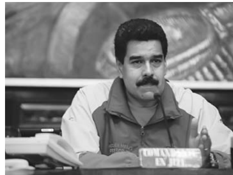
El presidente venezolano, Nicolás Maduro.