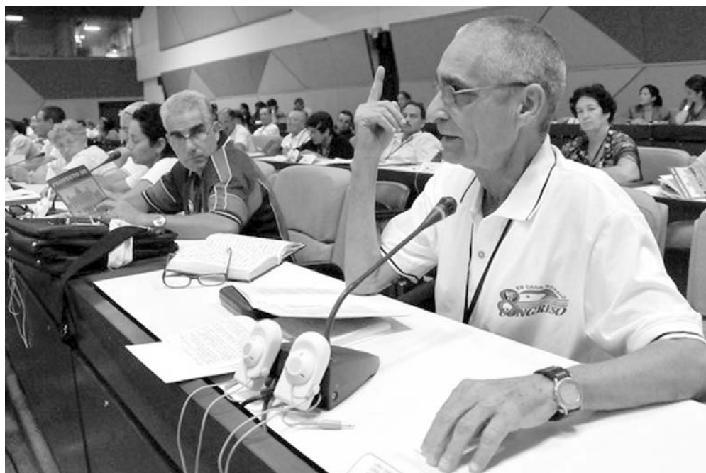
Las comisiones debatieron ayer sobre cuestiones de funcionamiento interno de la organización.