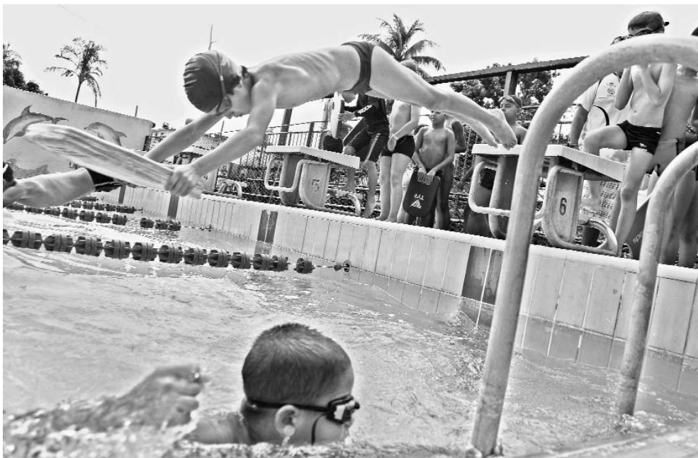
La progresión de los futuros nadadores depende de la sistematicidad en la práctica desde edades tempranas.

¿Cuánto se necesita para rescatar una piscina? ¿Se establecen procesos idóneos de captación y formación de talentos? ¿Constituye la natación una disciplina deportiva extendida a todos los municipios de la capital? ¿El convenio INDER-Ministerio de Educación relacionado con los ho-