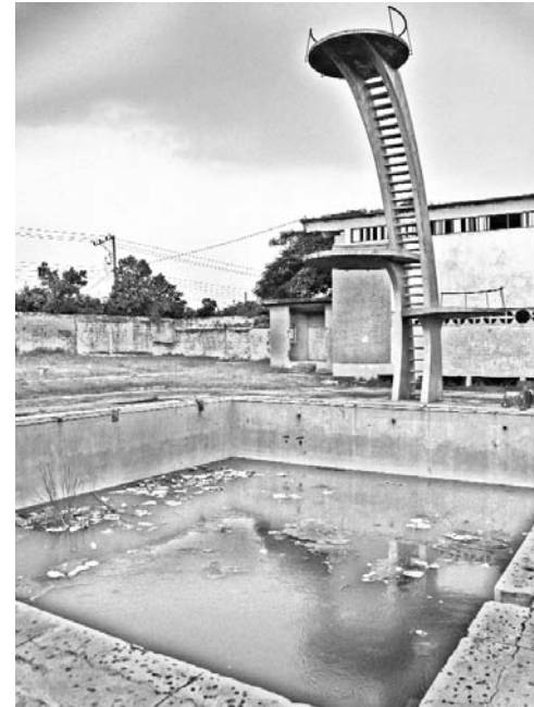
El Ciro Frías sufre la acción del tiempo y su rescate constituye todavía una quimera.