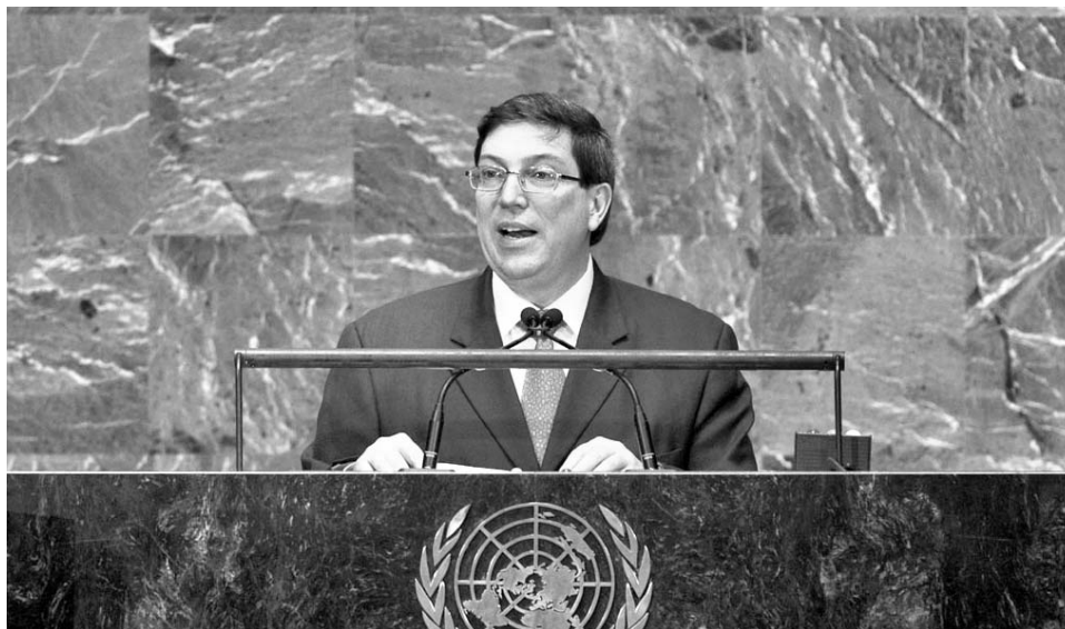
El canciller cubano, Bruno Rodríguez Parrilla, intervino en la reunión a nombre de la CELAC.

“Hacemos un llamado a todos los Estados, particularmente a los Estados poseedores de armas nucleares, a eliminar la función de las armas nucleares en sus doctrinas, políticas de seguridad y estrategias militares”, dijo en el foro, convocado a partir de una iniciativa de Cuba apoyada por el Movimiento de Países No Alineados (MNOAL).