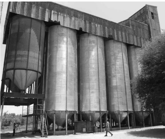
Desde el año pasado hasta la fecha han sido sustituidos 17 de estos enormes silos industriales.

los laboratorios de los recintos industriales de la empresa.