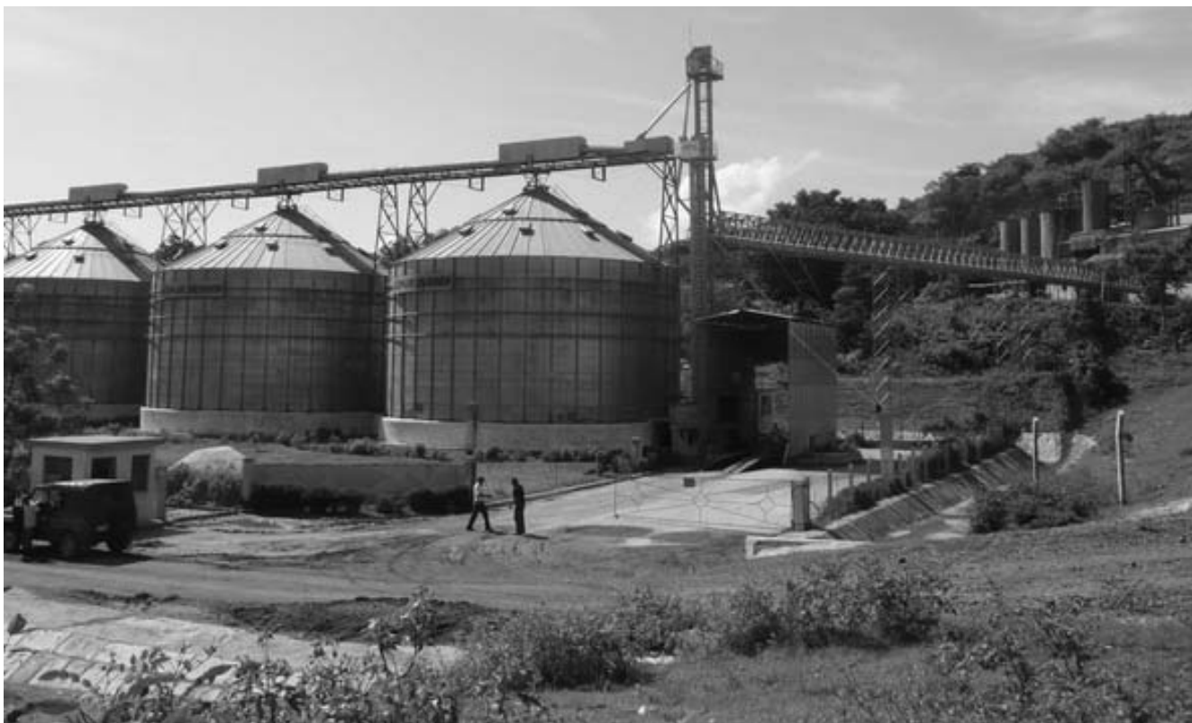
La vinculación aérea entre el molino (derecha) y los silos de almacenamiento aprovecha la irregularidad del terreno y evita la transportación en camiones del producto terminado.

Aguilar agregó que aun cuando faltan por terminar cuatro, ha sido particularmente ejemplar la modernización de todos