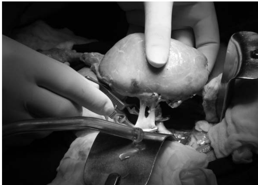
Por cada donante, cuatro personas como mínimo podrían salvarse. Cuba es el país de menor negativa familiar a la donación en toda Latinoamérica.

Hoy, gracias a una inversión del Ministerio de Salud Pública cubano, de más de medio millón de dólares, el programa nacional de trasplantes se revitaliza. Es una