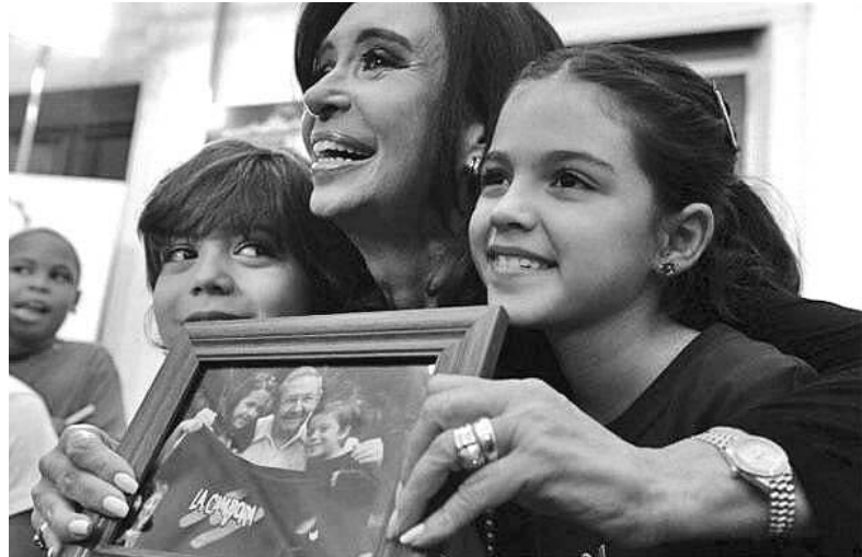
Cristina Fernández compartió por casi una hora con los niños de La Colmenita.

Los especialistas concluyen mañana una semana de familiarización en ocho capitales de estados, donde realizan visitas a hospitales y clínicas públicas de esos territorios, conocen las principales dolencias de cada zona y las condiciones de vida de la población, según voceros del Ministerio brasileño de Salud. (PL)