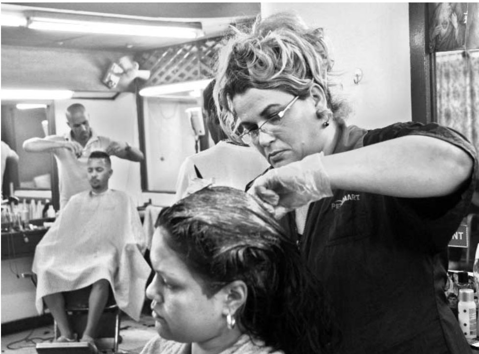
Los trabajadores de peluquerías y barberías se quejan por no tener un mercado mayorista donde adquirir los insumos.

pesar de no contar con un mercado mayorista donde adquirir los productos.