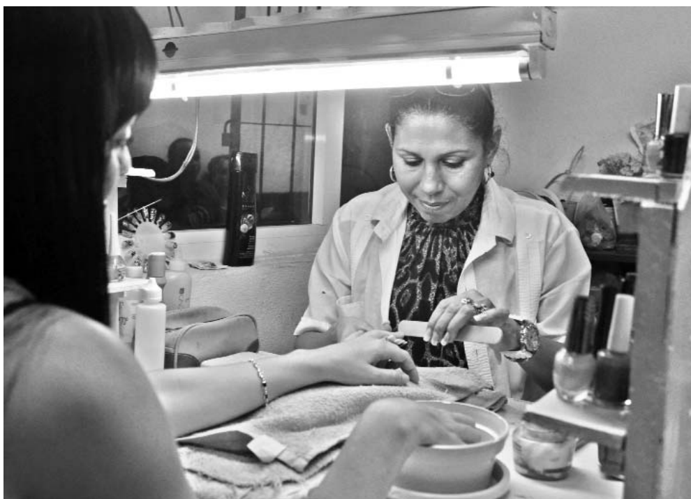
Los precios ofertados en los locales arrendados gozan de una buena aceptación por parte de la población.

En el caso de estos últimos, dijo, el MINCIN les garantizará el mismo Plan de Abastecimiento que tenía destinado para esos servicios; y los productos que contempla los comprarán en el canal mayorista del Comercio Interior, pero a un precio minorista, menos el 20 %.