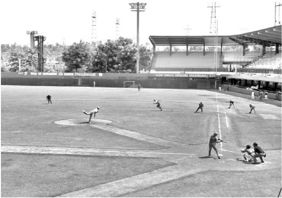
Las magníficas condiciones del terreno han sido reconocidas por los jugadores en desafíos de preparación.