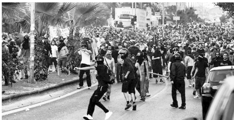
Una de las manifestaciones en Atenas.

ATENAS.—Un asesinato de trasfondo político sacudió a Grecia, aumentando la tensión social en el país, paralizado por la huelga general de dos días contra la política de austeridad del Gobierno. El miembro del partido neonazi griego Amanecer Dorado Yorgos Poupakias confesó el asesinato de Pavlos Fissas, luchador por los derechos humanos y militante del grupo de izquierda Antarsia.