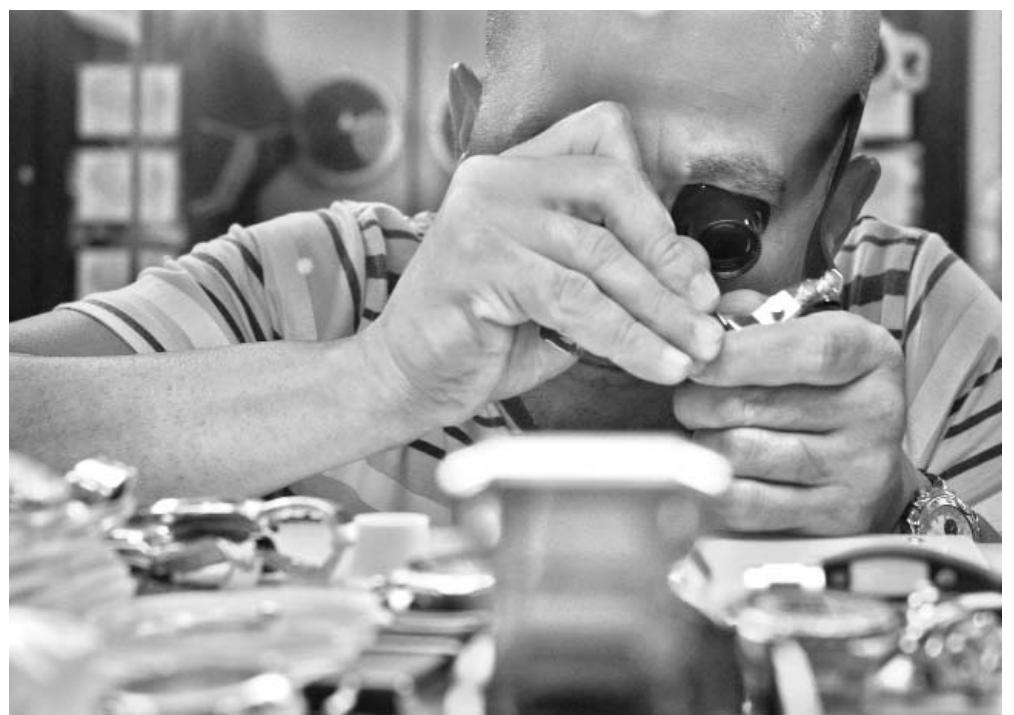
Las relojerías son otras de las gestiones no estatales que en menor medida han arrendado locales.