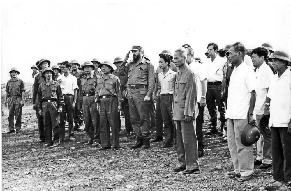
El Jefe de la Revolución cubana en la zona liberada.

H ACE APENAS tres días nos visitó un alto dirigente del Partido Comunista de Vietnam. Antes de marcharse, me transmitió el deseo de que yo elaborara algunos recuerdos de mi visita al territorio liberado de Vietnam en su heroica lucha contra las tropas yanquis en el sur de su país.