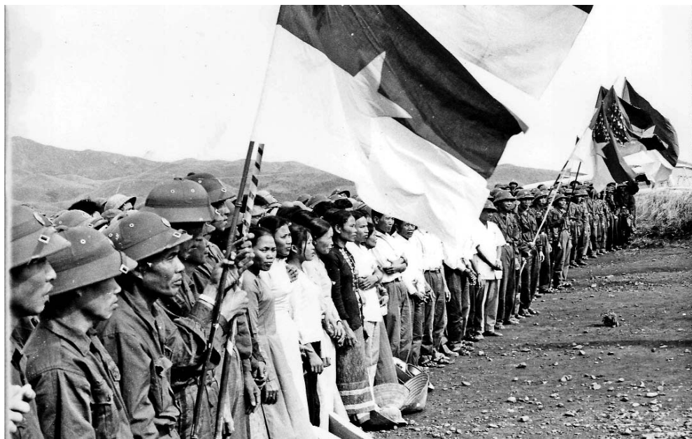
Los combatientes en la zona liberada de Vietnam del Sur.