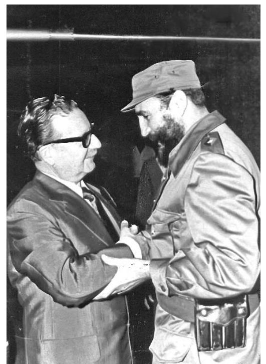
Fidel junto a Allende en La Habana.