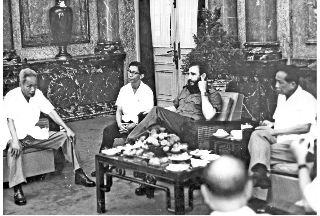
Las conversaciones con Pham Van Dong y otros dirigentes.

BBC, que suele estar bien informada en la materia. Eso es ya un descubrimiento de la ciencia, pero cuánto será necesario invertir para convertir en realidad tales objetivos.