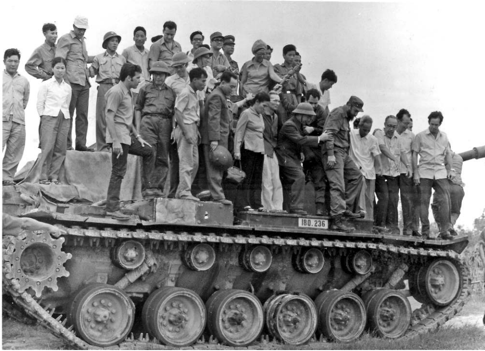
Sobre uno de los tanques norteamericanos capturados.