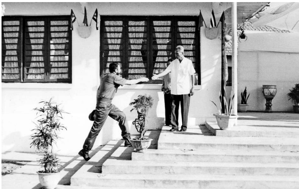
El Comandante es recibido por Pham Van Dong.

Para extraer la enorme energía derivada de un núcleo de hidrógeno se necesita crear un plasma de gas de más de 200 millones de grados centígrados, el calor necesario para forzar a los átomos de deuterio y tritio a fusionarse y liberar energía, según explica un despacho de la