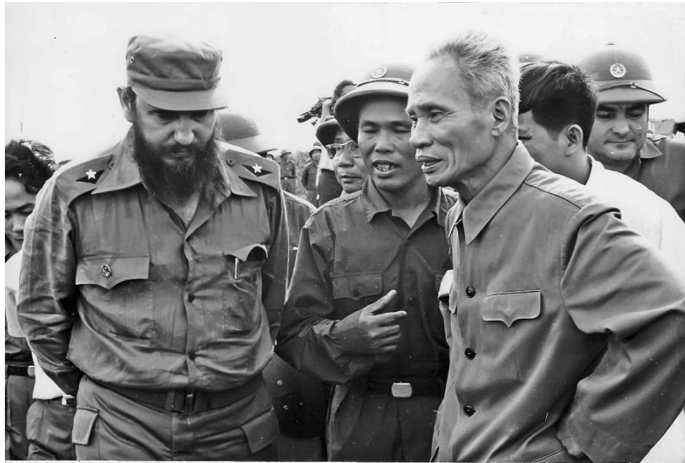
Fidel junto a Pham Van Dong, Primer Ministro vietnamita.