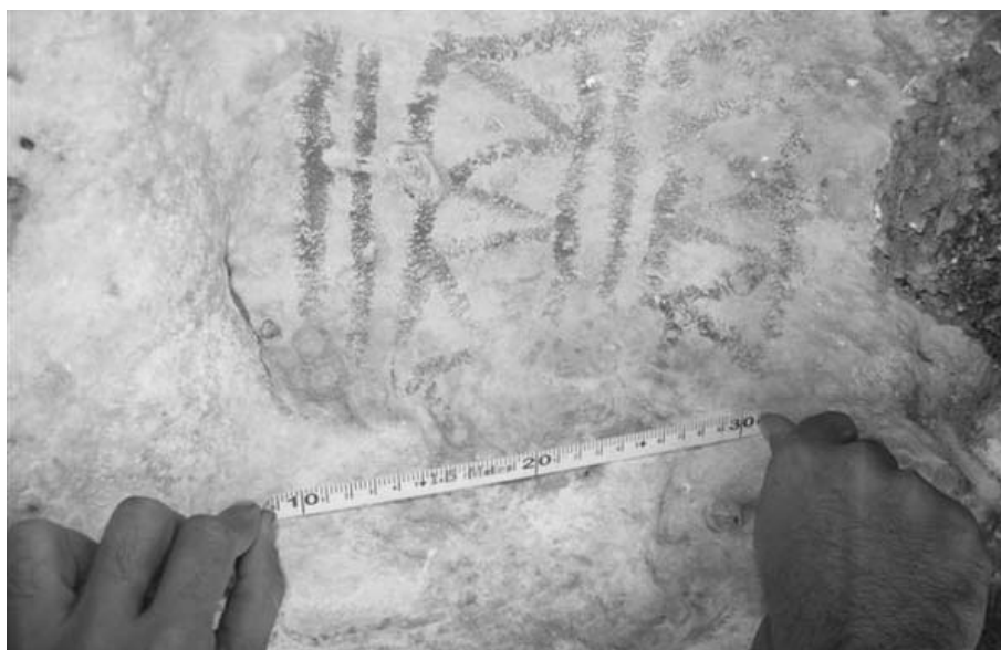
En las imágenes pueden apreciarse algunas de las pictografías encontradas durante las expediciones.

“Empezamos los trabajos en la Reserva Natural de Imías, que ocupa una superficie de 22,6 kilómetros cuadrados, y la escogimos precisamente por tratarse de una área protegida, existir un desconocimiento grande de la arqueología de la zona, y el apoyo ofrecido por las autoridades locales y del Museo Municipal en el aseguramiento material de las tres expediciones emprendidas en los años 2011,