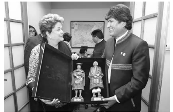
Los presidentes de Brasil, Dilma Rousseff, y de Bolivia, Evo Morales, durante el encuentro en Suriname.

Según el recién nombrado canciller brasileño, Luiz Alberto Figueiredo, "al principio de la reunión, la Presidenta le