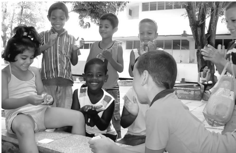
Como en años anteriores, la educación cubana asegura feliz distracción para miles de niños, mientras mamá y papá trabajan.

Con esa convicción trabajemos para que el color cubano que tanto defendió Nicolás Guillén como aspiración y la justicia social más plena sean cada vez más cercanas y promisorias realidades.