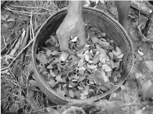
Convoca la mesa de conversaciones foro sobre el tema de la solución al problema de los cultivos ilícitos como la coca (en la foto).

La guerrilla mantiene su posición de que la forma de validar un acuerdo que ponga fin a las hostilidades debe ser debatida en la mesa de diálogos. Su posición desde el comienzo de las conversaciones es la convocatoria de una Asamblea Constituyente, un mecanismo que consideran necesario