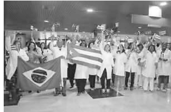
Los médicos cubanos a su llegada el sábado a Recife, Brasil.

Acompañada del titular brasileño de Salud, Alexandre Padilha, Cobas saludó la iniciativa de la presidenta Dilma Rousseff, de apostar por una vida sana para sus ciudadanos, pues los pueblos necesitan salud para desarrollarse.