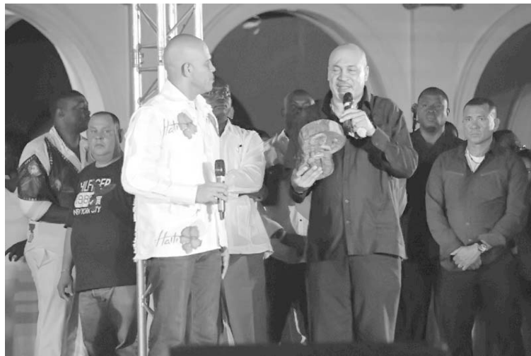
Los presidentes Michel Martelly, de Haití y Desiré Delano Bouterse, de Suriname en la clausura de Carifesta.

Exhibiciones de artes marciales y performances también formaron parte de la última jornada de la cita estival, la más importante que celebran los países del Caribe y América Latina.