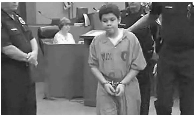
Esposado y escoltado por varios policías, el niño comparece ante el tribunal.