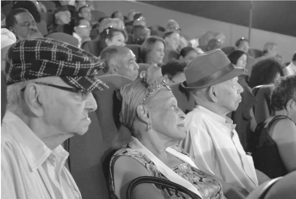
En los plenos de la UNEAC se ha analizado y hecho promoción a los aportes de los afrodescendientes a la nacionalidad cubana.

En 1998, la vanguardia intelectual y artística, en diálogo con el propio Fidel, había advertido durante un Congreso de la UNEAC, la necesidad de abordar el problema. Durante la primera década de este siglo fueron adoptados programas destinados a sectores desfavorecidos de la sociedad con un impacto medible entre los afrodescendientes. El actual proceso de implementación de los Lineamientos Económicos y Sociales aprobados por el último Congreso del Partido debe sentar las bases de un desarrollo sustentable que se traduzca progresivamente en niveles de prosperidad. En su aplicación a escala local, cada una de las acciones que se emprenden tendrá que tomar en cuenta la focalización, sin visos