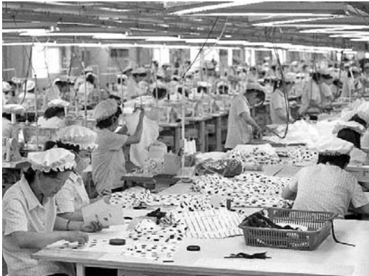
El Complejo Industrial de Kaesong acoge 123 empresas del Sur que emplean a 54 mil obreros del Norte.

El complejo industrial de Kaesong, ubicado al sudeste de la RPDC, comenzó a funcionar en el año 2004 como un proyecto de