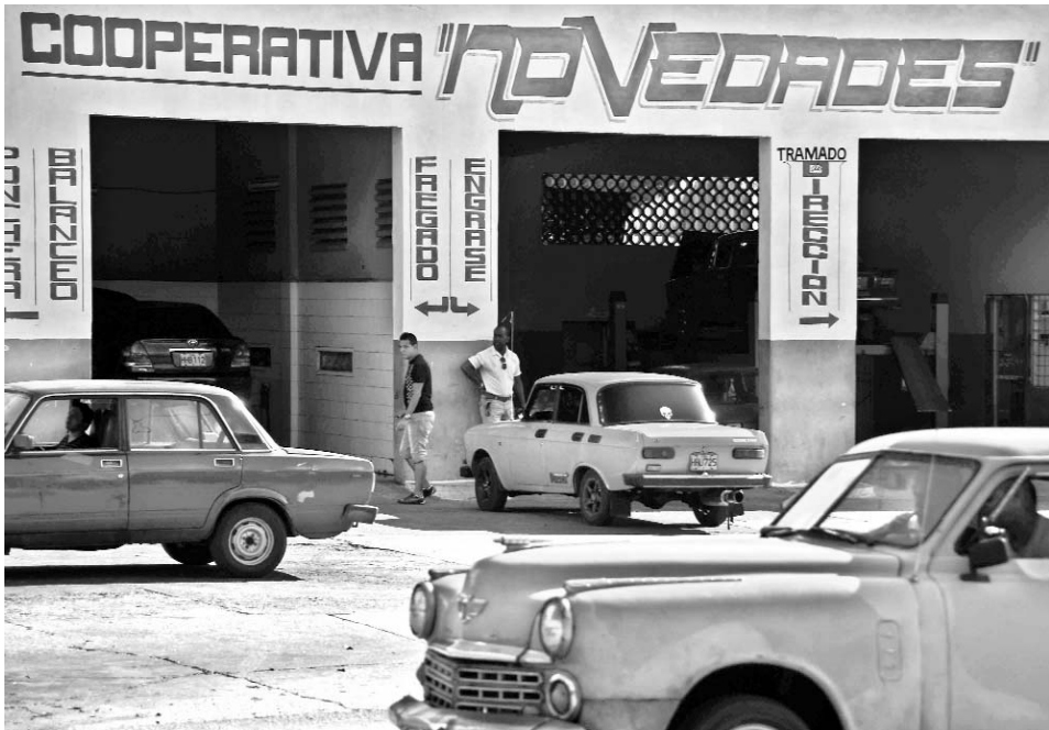
La Cooperativa Novedades brinda servicios todos los días en el horario de siete de la mañana a siete de la noche.