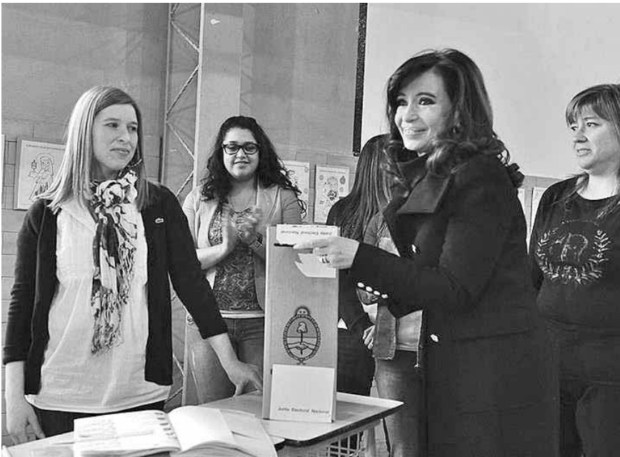
La Presidenta argentina ejerciendo su derecho al voto en las pasadas elecciones primarias.

Entre las novedades estuvo el estreno de 592 mil 344 jóvenes de 16 y 17 años (el 2 % del padrón electoral), luego de que el 31 de octubre del 2012 la Cámara de Diputados sancionara la Ley 26774 de Ciudadanía Argentina, que los habilita a votar. Otra particularidad fue que en esta ocasión no se sellaron los DNI como constancia de emisión de voto, ya que fueron reemplazados por un cuño impreso con los datos del elector y un código de barras único e intransferible. Para la propia