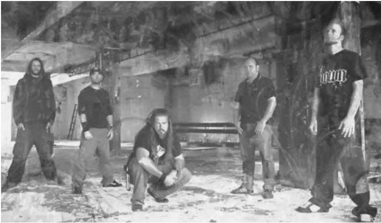
La banda francesa S-Core, una de las promesas del cartel metalero.