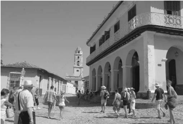
La villa trinitaria celebrará su medio milenio en enero del 2014.

A más de 30 millones de pesos asciende el valor de las labores ejecutadas, tanto en la cabecera provincial como en la ciudad de Trinidad, entre las que se cuentan la reconstrucción del Parque Maceo —más conocido como de La Caridad—, la Avenida de los Mártires, el Teatro Principal,