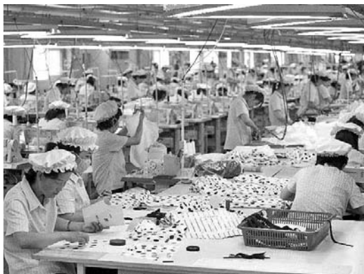
El Complejo Industrial de Kaesong acoge 123 empresas del Sur que emplean a 54 mil obreros del Norte.

El complejo industrial de Kaesong, ubicado al sudeste de la RPDC, comenzó a funcionar en el año 2004 como un proyecto de