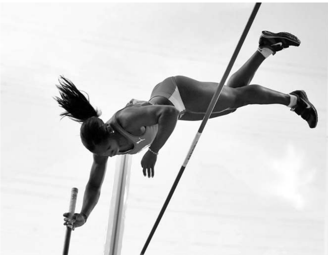
La pinareña de 26 años sumó el bronce universal a su plata olímpica en una final muy pareja.