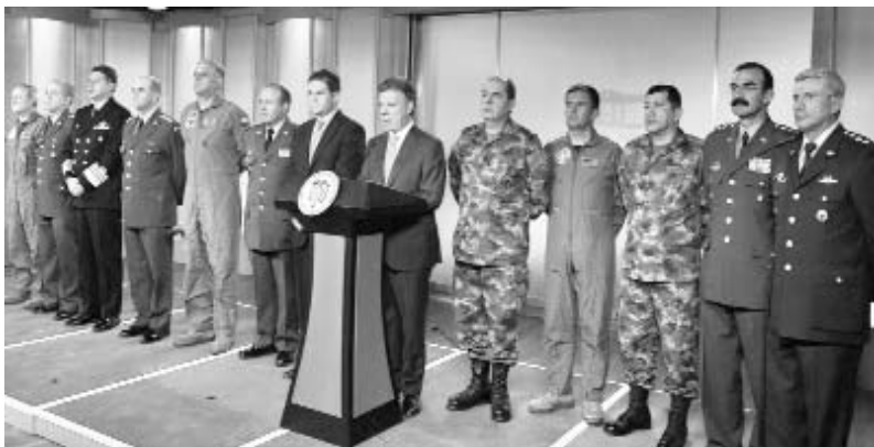
El presidente colombiano (centro) junto a la cúpula saliente y la entrante en la Casa de Nariño.

BOGOTÁ.—El presidente de Colombia, Juan Manuel Santos, emprendió cambios profundos en la cúpula militar, a pocos días de haber iniciado su último año de Gobierno.