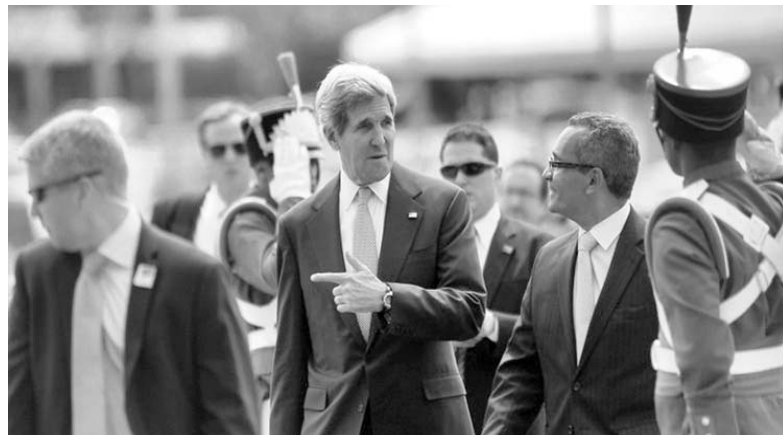
El secretario de Estado norteamericano, John Kerry llegó este martes a Brasil procedente de Colombia.

El diario colombiano El Tiempo consideró que, ante los avances registrados en las conversaciones de paz, los nuevos comandantes tendrán dentro de sus grandes retos "liderar el paso hacia el posconflicto de unas fuerzas militares de casi 300 mil hombres que llevan 40 años en guerra".