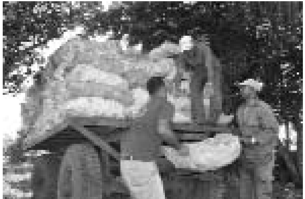
La cooperativa tendrá la responsabilidad de abastecer cuatro mercados agropecuarios de La Habana.