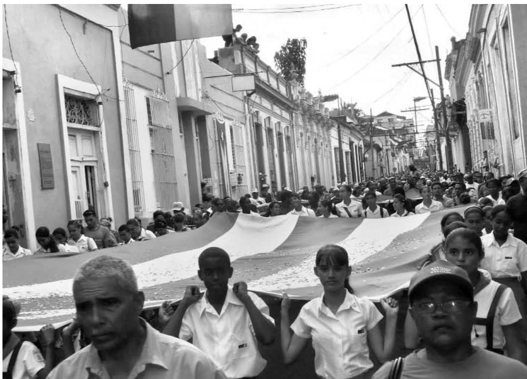
Homenaje a Frank País en las calles de Santiago de Cuba.

En nuestra sociedad, el texas no puede ser el batazo de moda.