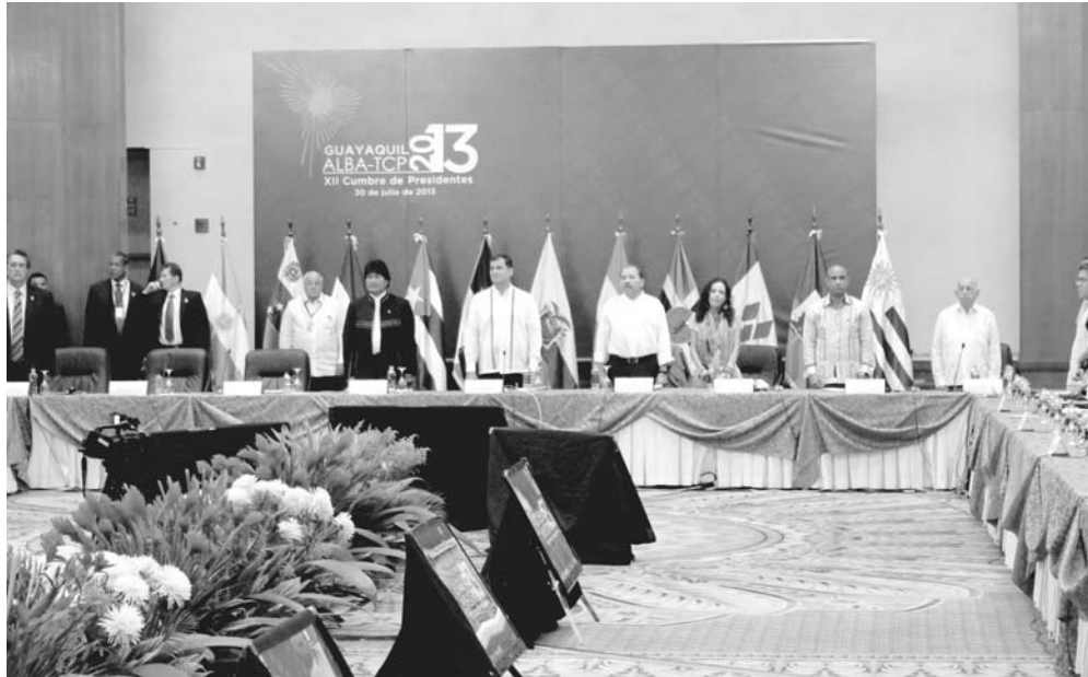
Representantes de los países miembros del ALBA en la inauguración de la XII Cumbre en Guayaquil, Ecuador.

ÓRGANO OFICIAL DEL COMITÉ CENTRAL DEL PARTIDO COMUNISTA DE CUBA