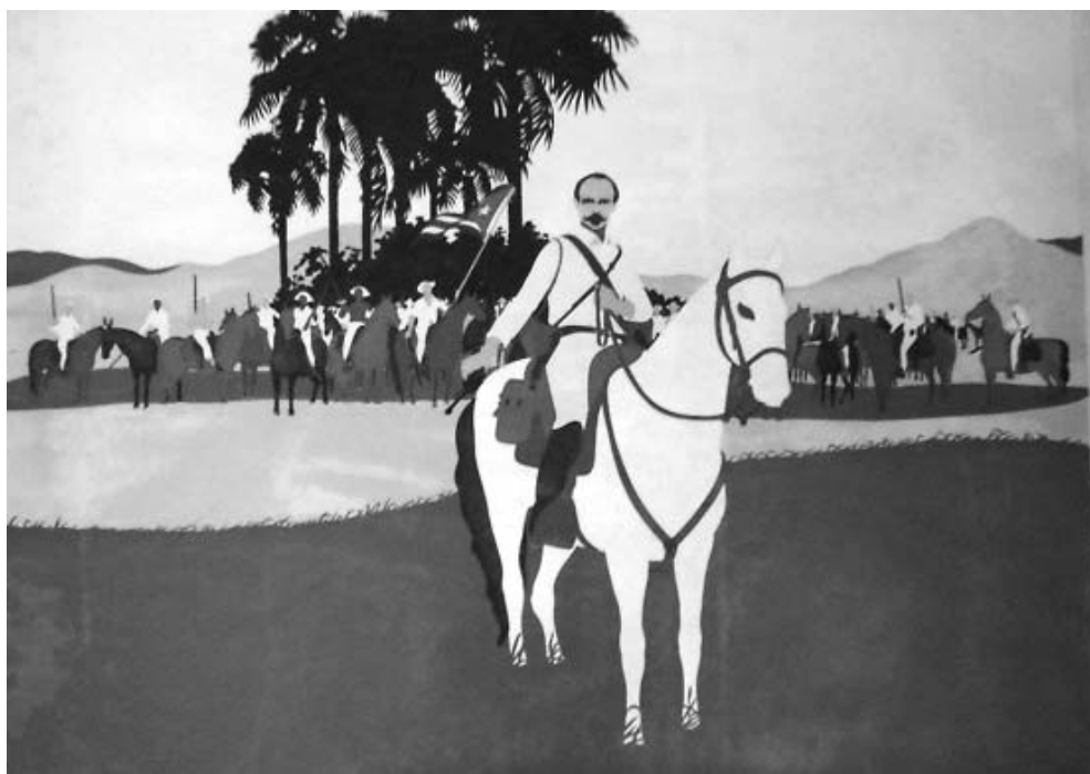
Como dijo Fidel: Martí fue el autor intelectual del Moncada.