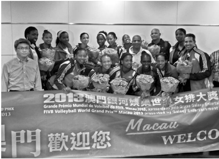
Las cubanas accedieron a posar para la prensa local a su llegada a la ciudad de Macao.