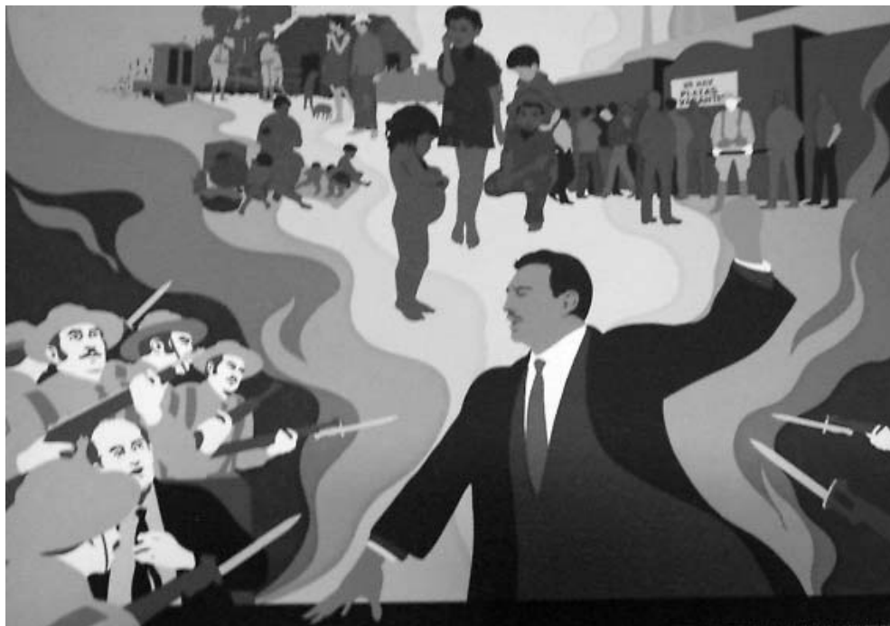
Con la detención de Fidel se abría un nuevo capítulo en la historia heroica del Moncada, que marcaría un hito, semanas después, con su autodefensa.