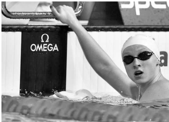
Katie Ledecky se ha adueñado de las distancias largas en la ciudad Condal.

Lo más notorio corrió a cargo de la jovencita de 16 años Katie Ledecky, a quien al parecer no le bastó su título olímpico de Londres en los 800 metros libre ni tampoco el de los 400 en la aper-