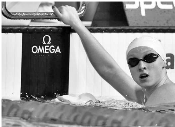
Katie Ledecky se ha adueñado de las distancias largas en la ciudad Condal.

Lo más notorio corrió a cargo de la jovencita de 16 años Katie Ledecky, a quien al parecer no le bastó su título olímpico de Londres en los 800 metros libre ni tampoco el de los 400 en la aper-