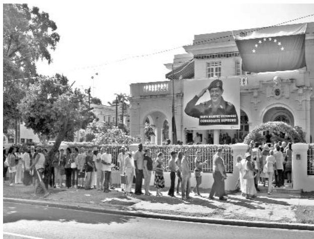
Los cubanos patentizaron su cariño al líder bolivariano.