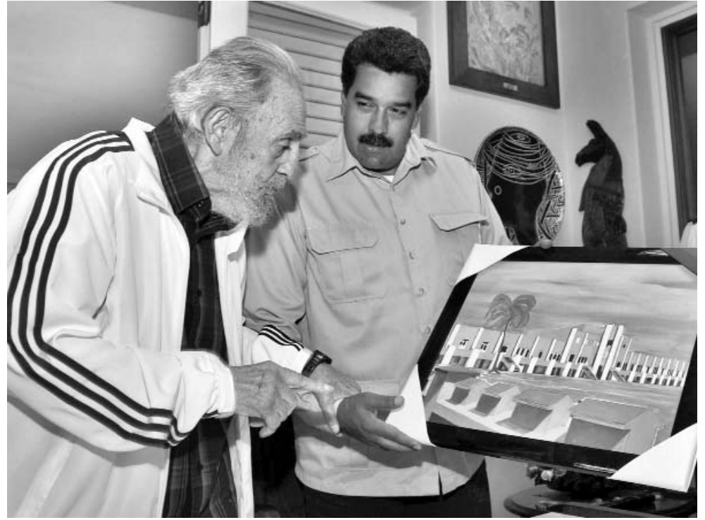
El Presidente Maduro obsequió al compañero Fidel un cuadro del Cuartel Moncada, dibujado por el entrañable líder de la Revolución Bolivariana, Hugo Chávez.