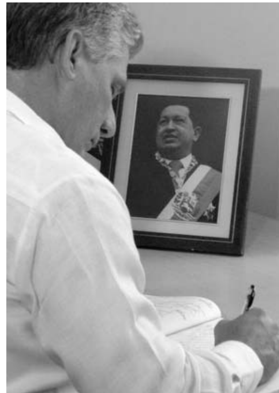
El Primer Vicepresidente cubano firma el libro de visitantes de la Embajada de Venezuela en La Habana.

Los dirigentes se sumaron a glorias deportivas, artistas y a decenas de personas de todas las edades que recordaron al gigante latinoamericano en su cumpleaños, como parte de la iniciati-