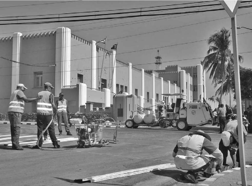
La histórica Posta 3 recibe los últimos toques.

ÓRGANO OFICIAL DEL COMITÉ CENTRAL DEL PARTIDO COMUNISTA DE CUBA