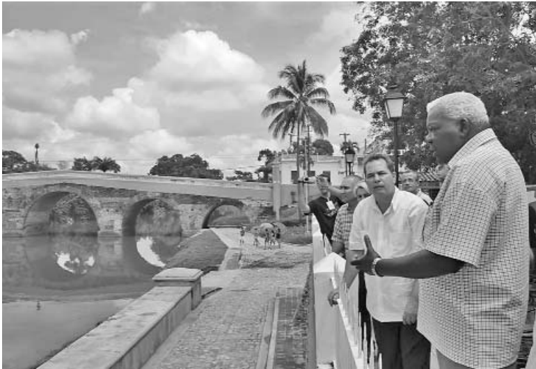
El Presidente de la Asamblea Nacional del Poder Popular constató la marcha de importantes obras sociales en el territorio.