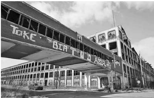
Varias zonas de Detroit se asemejan a una “ciudad fantasma”.

Al igual que Bolivia, los estados miembros del MERCOSUR convocaron a sus representantes ante esas naciones europeas, con el fin de asumir una resolución conjunta. (PL)