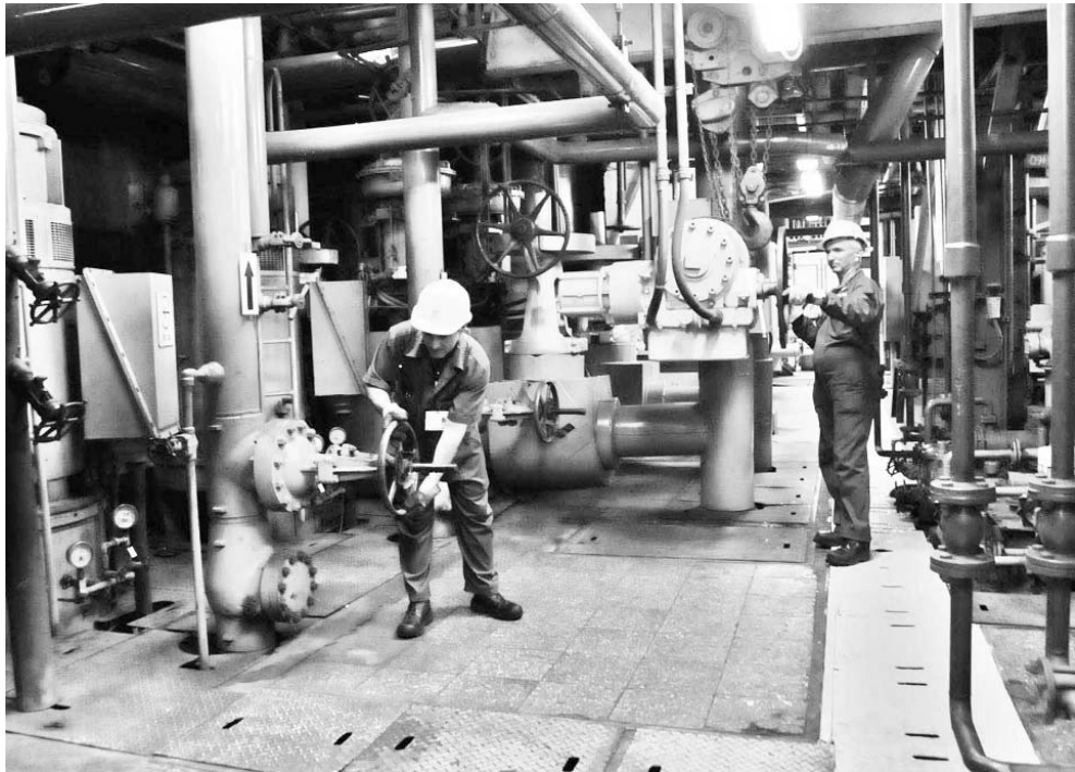
Trabajadores en el área de turbinas durante el turno nocturno.

Vanguardia Nacional por 33 años, sobresale aquí la eficiencia, el ahorro, el control, la disciplina, la cultura industrial, la inventiva y el sentido de pertenencia de sus más de 400 obreros