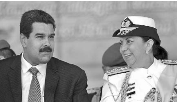
El Presidente venezolano, Nicolás Maduro, junto a la ministra de Defensa, Carmen Meléndez.

La Cancillería venezolana indicó que con el respaldo dado por el Departamento de Estado a “la agenda injerencista” de Power,