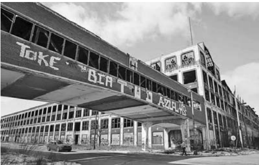
Varias zonas de Detroit se asemejan a una “ciudad fantasma”.

Al igual que Bolivia, los estados miembros del MERCOSUR convocaron a sus representantes ante esas naciones europeas, con el fin de asumir una resolución conjunta. (PL)