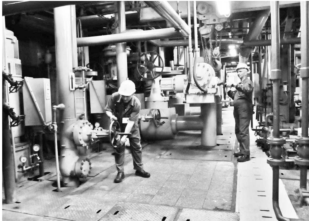
Trabajadores en el área de turbinas durante el turno nocturno.

Vanguardia Nacional por 33 años, sobresale aquí la eficiencia, el ahorro, el control, la disciplina, la cultura industrial, la inventiva y el sentido de pertenencia de sus más de 400 obreros