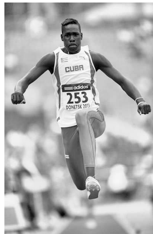
Lázaro Martínez superó su tope precedente e igualó el récord para campeonatos del mundo en triple con 16.63 metros.

Este golpe no es el único para los bóldos de la tierra del reggae , pues hace un mes, Veronica Campbell-Brown dio posi-