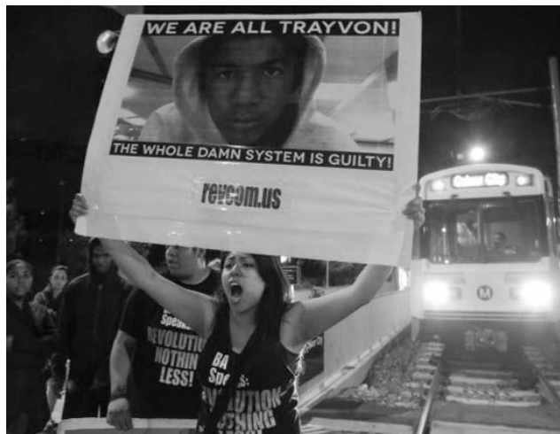
Varios manifestantes bloquean una línea de tren en Los Ángeles con un cartel que dice: “Todos somos Trayvon. Todo el maldito sistema es culpable”.

La multitud que se concentró dos días ante el tribunal en espera del veredicto recibió conmovida el impacto del “no culpable”. Pero de inmediato el estuor se transformó en rabia. En Stanford, Nueva York, Washington, San Francisco, Chicago, Filadelfia y Los