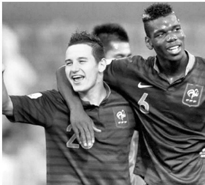
Francia se coronó en el Mundial sub-20 de Turquía, tras imponerse a Uruguay en una agónica final en la tanda de penales.

Así que la única esperanza para los cubanos reside en avanzar como uno de los dos mejores terceros lugares, aunque para ello estarán obligados estrictamente a ganar a Belice