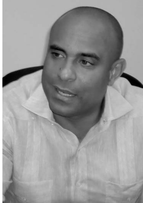
Primer ministro de Haití, Laurent Lamothe.

Asimismo, explicó que se acometen acciones constructivas en cinco aeropuertos del país entre los que se incluye la