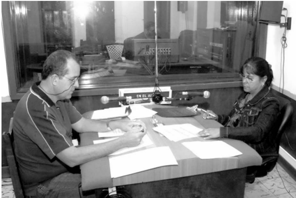
Parte del colectivo del programa Patria.