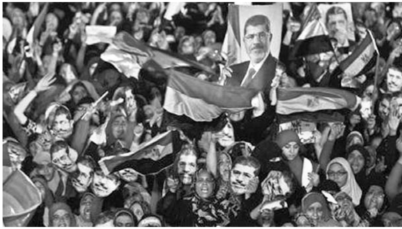
Seguidores de Mursi convocaron a nuevas protestas para este lunes.

El Ejército sirio ha descubierto en la capital un almacén de sustancias químicas tóxicas perteneciente a los insurgentes, según informó la televisión de ese país. El depósito fue diseñado tanto para la producción como el almacenamiento de sustancias, entre las cuales se encontró cloro. La semana pasada, el ministro ruso de Asuntos Exteriores, Serguéi Lavrov, insistió en la validez de las pruebas de una investigación independiente, presentada ante la ONU y cuestionada por EE.UU., que demuestran que insurgentes sirios usaron gas sarín en Aleppo, en marzo. (Russia Today)