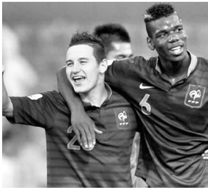
Francia se coronó en el Mundial sub-20 de Turquía, tras imponerse a Uruguay en una agónica final en la tanda de penales.

Así que la única esperanza para los cubanos reside en avanzar como uno de los dos mejores terceros lugares, aunque para ello estarán obligados estrictamente a ganar a Belice