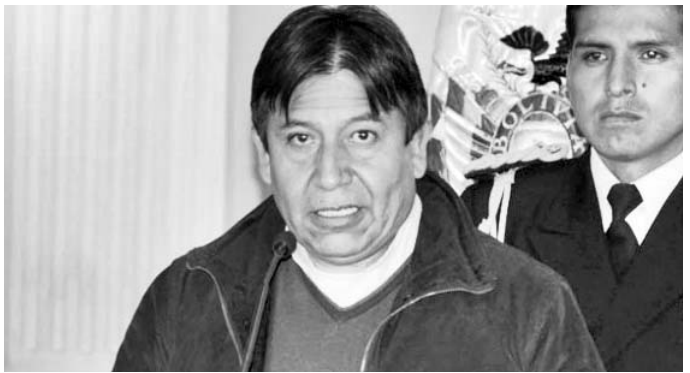
El canciller boliviano, David Choquehuanca.

Uno de los líderes de los Hermanos Musulmanes, el poderoso movimiento islamista del que forma parte Mursi, urgió a los egipcios a estar dispuestos a sacrificar sus vidas para prevenir un golpe de Estado e hizo referencia a la sangre vertida para obtener la caída del expresidente Hosni Mubarak en el 2011.