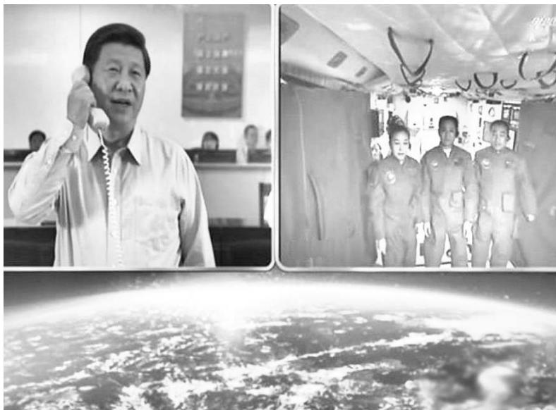
El presidente Xi Jinping y los astronautas chinos sostuvieron una video llamada.

“LASA sencillamente es crucial, no solo por lo que se presenta allí, sino por todos los proyectos que se planifican, de libros futuros, de investigaciones, de que la gente se conozca”, concluye.