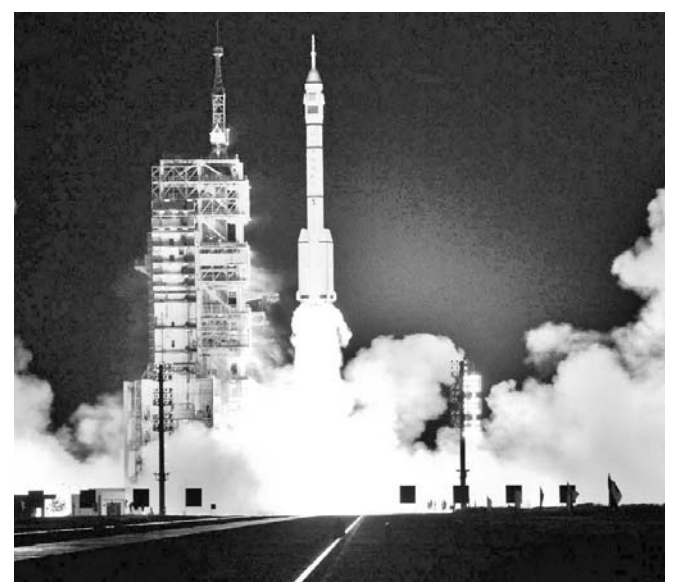
El equipo de astronautas partió al espacio el 11 de junio, a bordo de la nave Shenzhou-X.

BEIJING.—En una video llamada a los tres astronautas chinos en órbita desde el 11 de junio, el Presidente Xi Jinping aseguró que el sueño espacial es parte del propósito de fortalecer a China como nación independiente, por lo que se darán pasos mayores en este sentido.