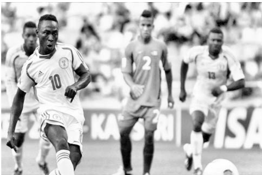
La selección de Nigeria derrotó 3-0 a Cuba en el Mundial Sub 20 de Turquía.