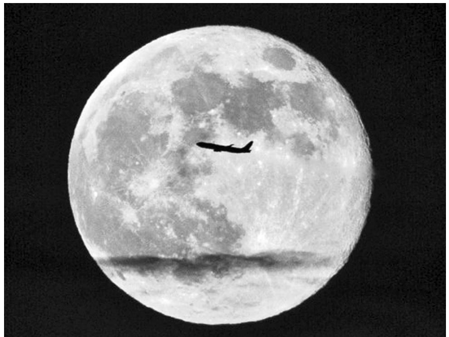
Una instantánea impresionante en la que queda inmortalizado un avión en Nueva York superpuesto en la Luna.

Muchas organizaciones también temen que esa normativa tenga un efecto negativo en las comunidades limítrofes, donde la mayoría de la población es latina.