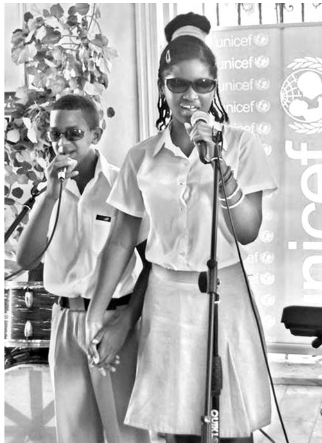
Estudiantes de la escuela especial para niños ciegos y débiles visuales Abel Santamaría, participan en la presentación del Estado Mundial de la Infancia 2013, niños y niñas con discapacidad, del Fondo de las Naciones Unidas para la Infancia (UNICEF)

Aquellos que inevitablemente nacen con algún tipo de limitación, sea física o mental, contarán siempre con la atención multidisciplinaria, que ayudará a sacar de ellos el máximo posible como sujetos sociales, afirmó. (PL/AIN)