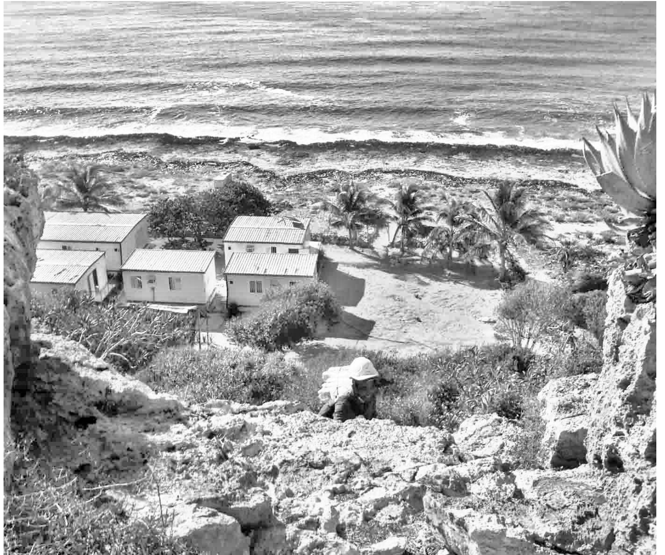
Solo el acceso al puesto fronterizo requiere alta preparación física.

Yosvani Serrano, por ejemplo, confiesa que lo más complejo fue superar la impresión de la llegada a la unidad, verse parado en la cima de una gran terraza marina, de siete escalones gigantes en forma de