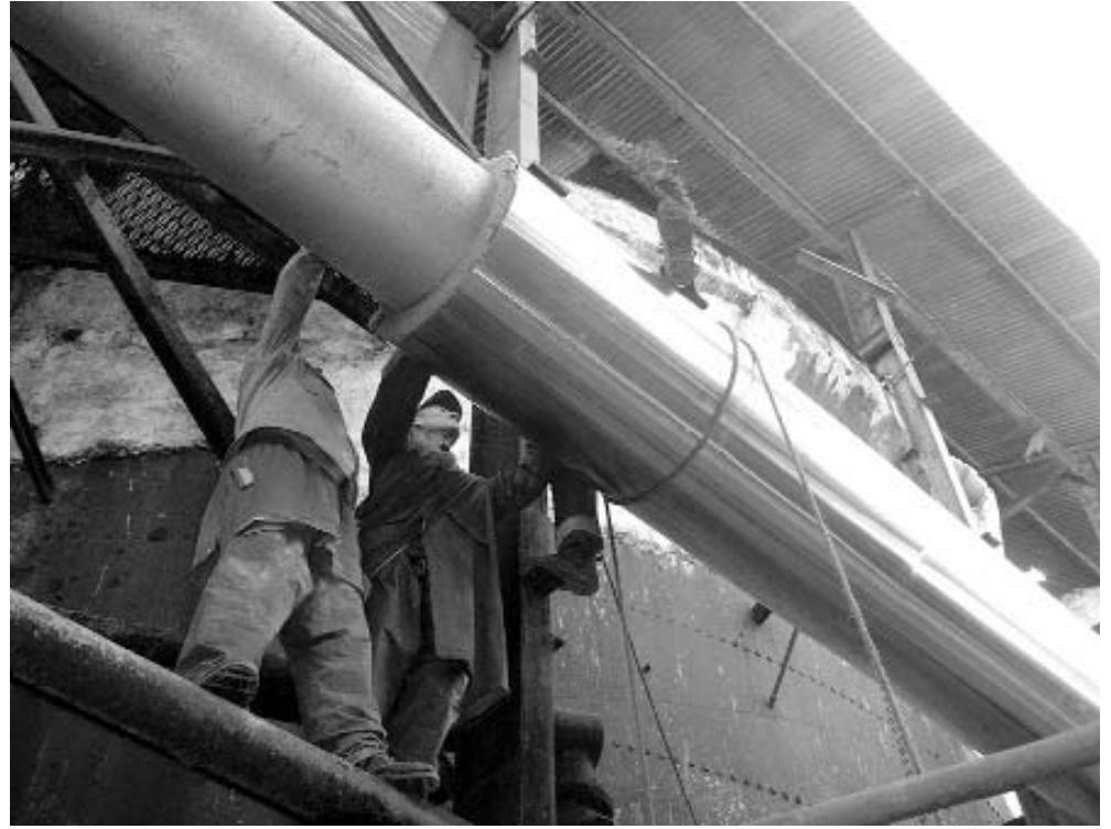
El montaje de la nueva tubería fue vital para la eficiencia del proceso.

Aún así, junto al componente material o tecnológico, la actual contienda se ha distinguido por un desempeño mucho más organizado y eficiente en toda el área de generación eléctrica, al punto de no registrar tiempo perdido en más de 130 jornadas.