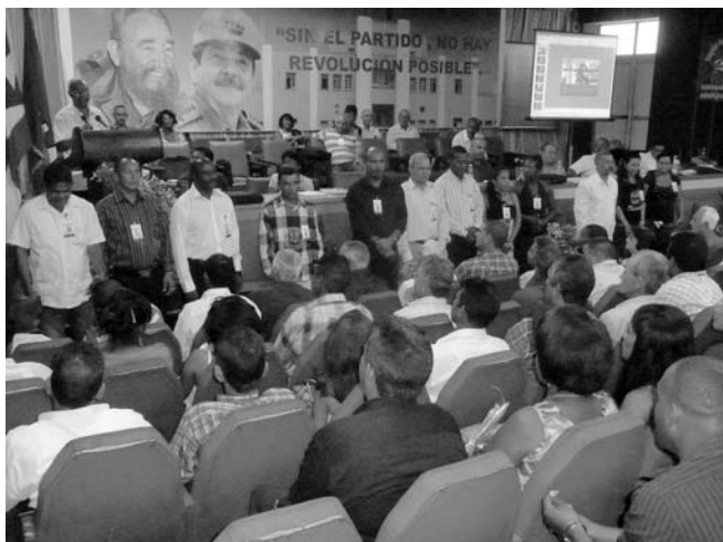
Instante en el que se presentó la nueva dirección de la ANAP en la provincia.

70 % de las producciones agropecuarias de la provincia, los campesinos santiagueros patentizaron en su asamblea la determinación de arribar al aniversario 60 de la gesta moncadista, con el cumplimiento de los compromisos establecidos hasta la fecha.