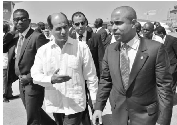
El primer ministro de Haití, Laurent Lamothe, fue recibido en el Aeropuerto Internacional José Martí por el vicescanciller cubano Rogelio Sierra.

Cuba desarrolla en Haití importantes proyectos de cooperación, fundamental-