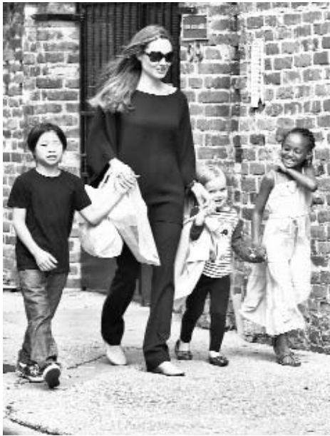
La actriz junto a tres de sus seis hijos.

La noticia dio la vuelta al mundo y su anuncio no