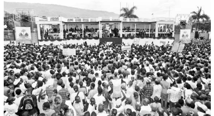
A la jornada de celebración asistieron miles de haitianos.

El sector del Turismo —subrayó— es uno de los que más avances ha registrado. Haití, como fundador y miembro de derecho de la Organización Mundial del Turismo, está de vuelta al circuito turístico internacional después de 25 años de ausencia.