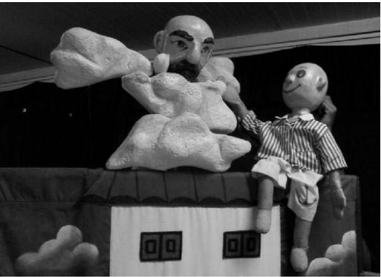
Un girasol pequeño del grupo Titirivida, de Pinar del Río.