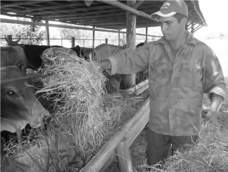
Gracias a esta estrategia es posible atenuar el impacto de la sequía y estabilizar la producción durante todo el año.

“Unido a esto, tratamos de obtener la mayor cantidad de hierba posible durante la primavera, para convertirla en heno, y guardarla para la época de sequía”.