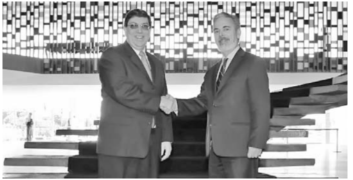
El Canciller cubano (izquierda) junto a su homólogo brasileño.

El Ministro cubano dijo que la jueza del caso ha permitido al antiterrorista René González permanecer en La Habana por el resto de su libertad condicional, tras reiterar su disposición a renunciar a la ciudadanía estadounidense. (PL)