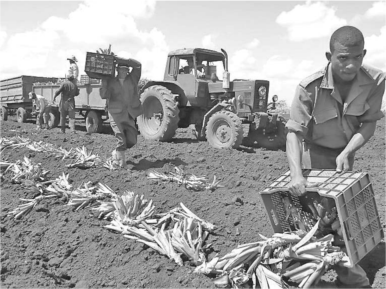
Plantas de la nueva variedad, nacidas en Cuba, pueblan los campos en desarrollo.

ductivas de la MD-2 aceptan su ley y comienzan a propagarla por la geografía avileña, en busca de un lugar que los especialistas dan por seguro, al menos, mientras la Empresa Agroindustrial de Ceballos siga siendo la emperatriz que ayude a esta reina a llegar al trono.