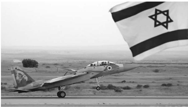
Siria acusa a Israel de atacar con misiles un centro militar en Damasco. Es el segundo ataque en tres días.

Nos respaldan el Derecho Internacional y la Carta de Naciones Unidas para responder a