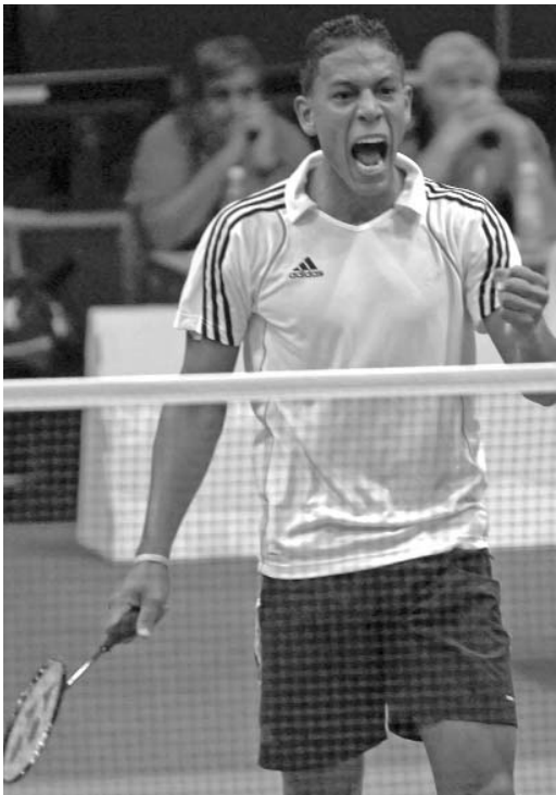
El mejor badmintonista cubano de todos los tiempos competirá en agosto, por primera vez, en un Campeonato del Mundo.

El resultado de semejante combinación pues, es obvio: Mientras más compite Osleni, mejor lo hace. Gana más ante adversarios mejor rankeados, y cada vez pier-