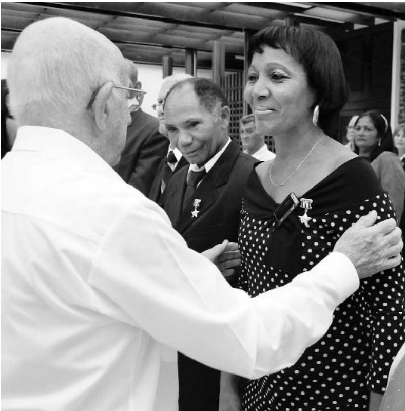
Machado Ventura impuso a diez destacados trabajadores el Título Honorífico de Héroes y Heroínas del Trabajo de la República de Cuba.