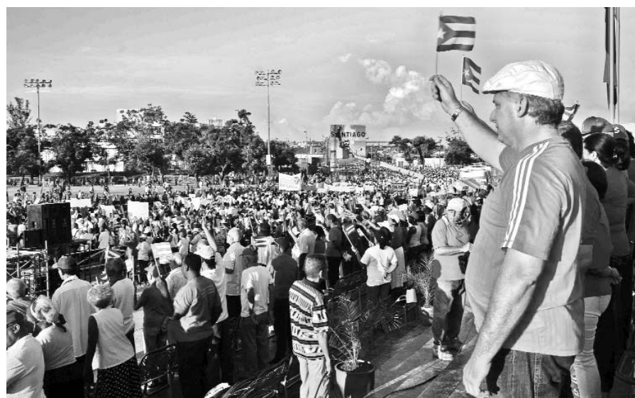
El Primer Vicepresidente Miguel Díaz-Canel encabezó el desfile en Santiago.