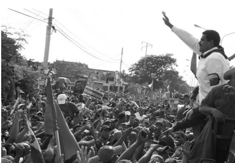
Maduro en el acto de campaña en el estado Sucre.

Luego, desde el estado Sucre, instó al can-