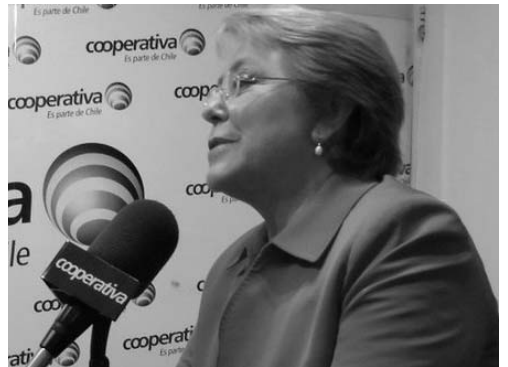
Michelle Bachelet en la entrevista concedida a Radio Cooperativa.

El presidente Sebastián Piñera puso en práctica una reforma tributaria para financiar las mejoras en la educación, que recauda unos mil millones de dólares al año, considerados insuficientes por los