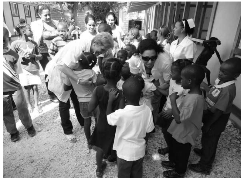
Los niños reciben con cariño a las doctoras cubanas.

Concluye el ensayo señalando que Marx no solo diagnosticó los defectos del capitalismo, sino también el resultado de esos defectos. “Si las autoridades no descubren nuevos métodos de asegurar oportunidades económicas justas para los trabajadores del mundo, estos pueden unirse y Marx podrá tener su venganza”.