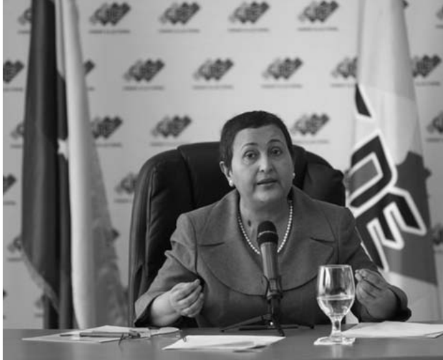
La presidenta del CNE, Tíbisay Lucena, informó que el cronograma electoral "se está cumpliendo estrictamente con lo pautado".

Aunque inicialmente ambos habían escogido Barinas, estado natal del líder bolivariano, Hugo Chávez, como punto