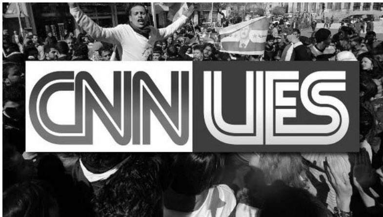
CNN Lies (miente), se lee en este fotomontaje.

El deshielo de los glaciares en el sur de Argentina a causa del cambio climático produce sedimentos de arcilla que afectan a las distintas especies que habitan los lagos de la región. "El agua proveniente de los glaciares trae consigo grandes cantidades de sedimentos. Estas partículas suspendidas en el agua resultan en diferentes proporciones de luz y nutrientes que pueden afectar la vida de las especies lacustres", dijo Esteban Balseiro, del Instituto de Investigaciones en Biodiversidad y Medioambiente. (EFE)