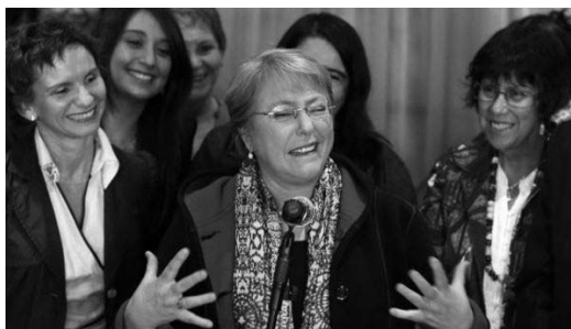
Michelle Bachelet, a su llegada a Chile el pasado 27 de marzo.

SANTIAGO DE CHILE, 1 de abril.—La expresidenta chilena y candidata a las próximas elecciones, Michelle Bachelet, prometió hoy que, de llegar nuevamente al Palacio de La Moneda, su primer proyecto de ley será uno que ponga fin al lucro en la educación, reportó PL.