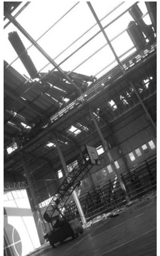
La Sala Deportiva Yara perdió gran parte de su techo a causa de la tormenta local severa en la tarde de ayer.

El vendaval tuvo una duración de unos 20 minutos —aproximadamente entre las 2:50