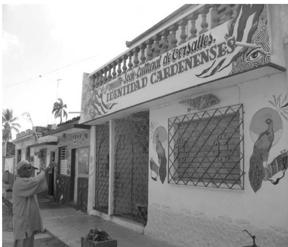
Todas las casas de la cuadra fueron pintadas.