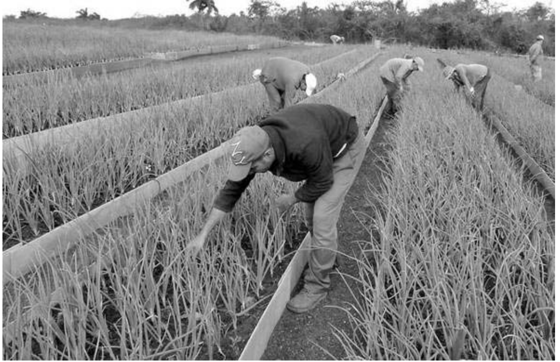
El aprovechamiento de una infraestructura dotada de sistemas de riego y un excelente sustrato, permitirá elevar la producción de alimentos.

En la actualidad, la industria villaclareña, además de trabajar en la producción, acabado y teñido o estampado de las telas, también labora en la creación de gasa quirúrgica e hilos de coser de la marca Ariadna.