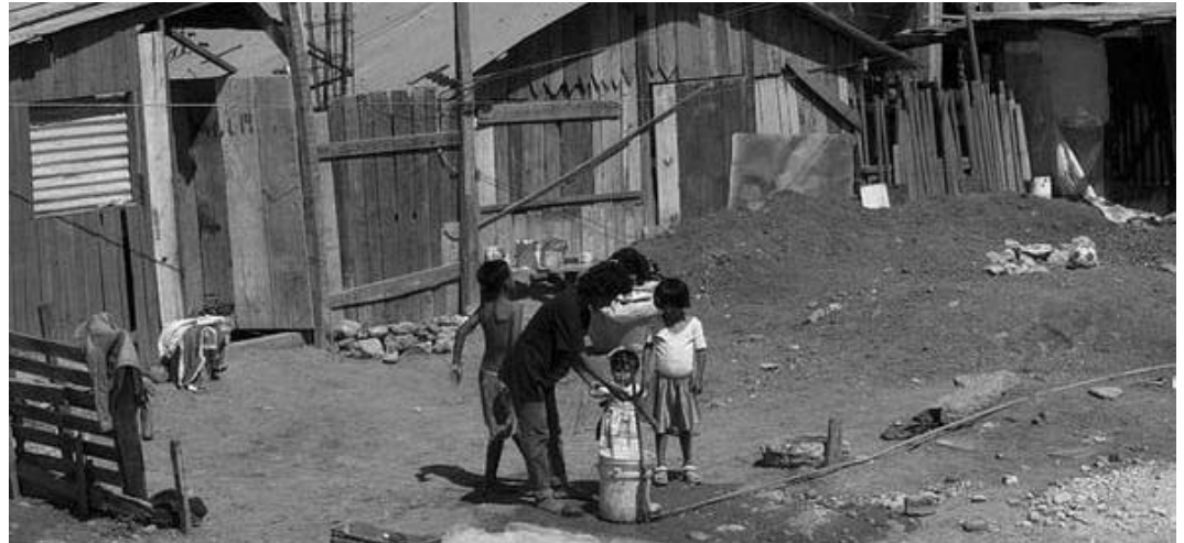
Según datos oficiales, en el 2011 murieron alrededor de 11 mil personas por desnutrición en México.

Entre los textos que podrán consultarse se encuentran la vigilancia del DEOPS a personalidades tildadas por la dictadura de "potencialmente peligrosas", entre las que se encuentran el Che, el cantante Chico Buarque, el Papa Juan Pablo II, el futbolista Pelé y otros.