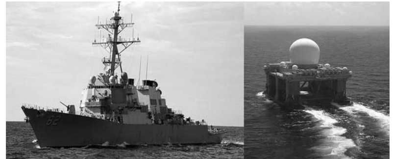
Buque destructor de EE.UU. y plataforma con radares, enviados en dirección a la Península Coreana.

La Asamblea Popular Suprema también apoyó la estrategia nacional, anunciada por el presidente Kim Jong-un, de potenciar el crecimiento económico y consolidar el estatus del país de Estado nuclear defensivo.