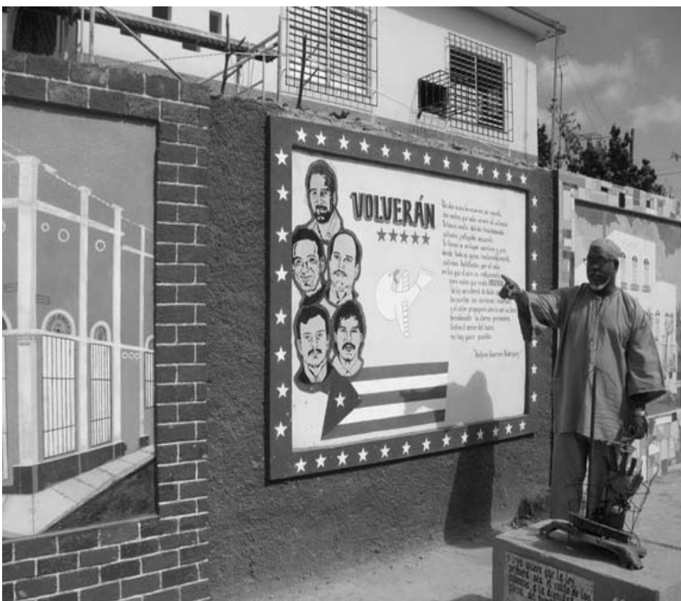
El proyecto incluye un espacio para los Cinco Héroe.