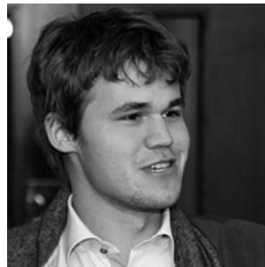
El noruego Carlsen será el rival de Anand.

La partida entre el israelí Boris Gelfand y el ruso Alexander