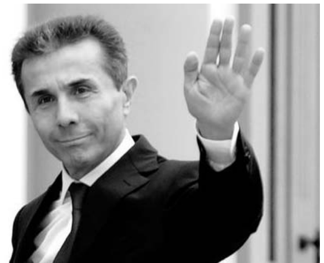
El nuevo primer ministro georgiano, Bidzina Ivanishvili, defiende una mejoría de las relaciones con Rusia.

De hecho Rusia manifestó recientemente su preocupa-