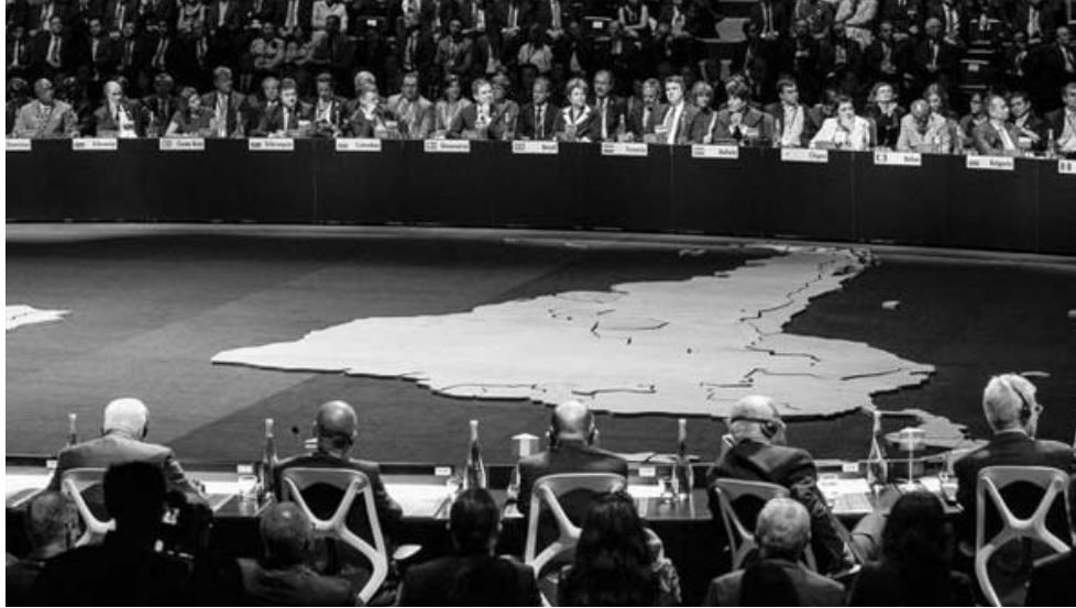
La creación de la CELAC ha sido el momento culminante de un proceso que podría llamarse “la revolución hemisférica de la desobediencia”.

operativo de las dictaduras latinoamericanas en esos años, fue diseñado e impulsado por la CIA en su carácter de organización clandestina global para practicar el terrorismo de Estado contra los movimientos populares latinoamericanos. Fue un plan de inteligencia y coordinación entre los servicios de seguridad de los regímenes militares en Argentina, Chile, Brasil, Paraguay, Uruguay y Bolivia, pero sus efectos criminales se hicieron sentir en todos los países de la región.