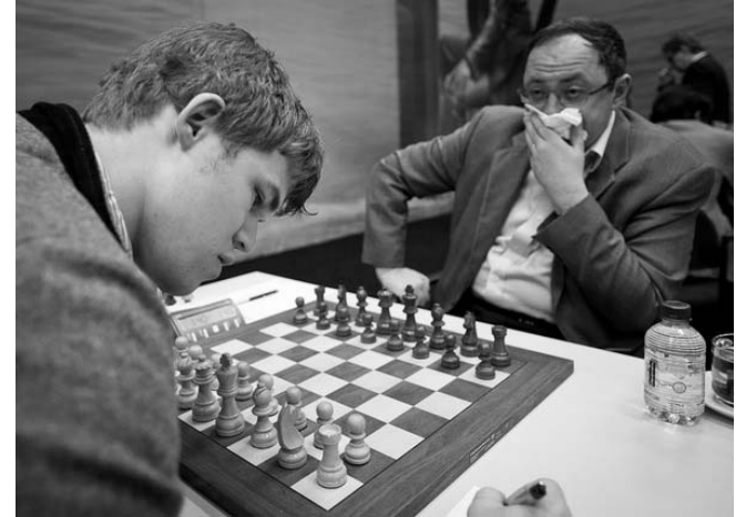
El más joven del certamen, Magnus Carlsen, y el más veterano, Boris Gelfand, principales protagonistas en la novena ronda.

La más combativa de las rondas de este torneo fue la octava. En ella el esperado segundo cotejo entre los líderes del momento: Carlsen vs. Aronian, concluyó pacíficamente dentro del Sistema Catalán planteado por el favorito de la justa, respirándose siempre igualdad a lo largo