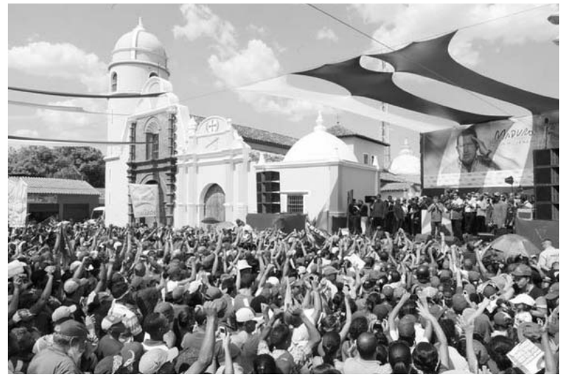
Miles de personas se unieron en Miranda al Presidente Encargado, Nicolás Maduro, para recordar la salida de Chávez de la cárcel en 1994.

Y en el negocio de las noticias, los medios tienen que fijar prioridades y elegir las historias que merecen su atención. Pero resulta que no solo las voces de los prisioneros hambrientos se ven acalladas, sino que los ciudadanos se quedan confundidos al enterarse de la verdad, privándose así de elegir el contenido mediático. (Russia Today)