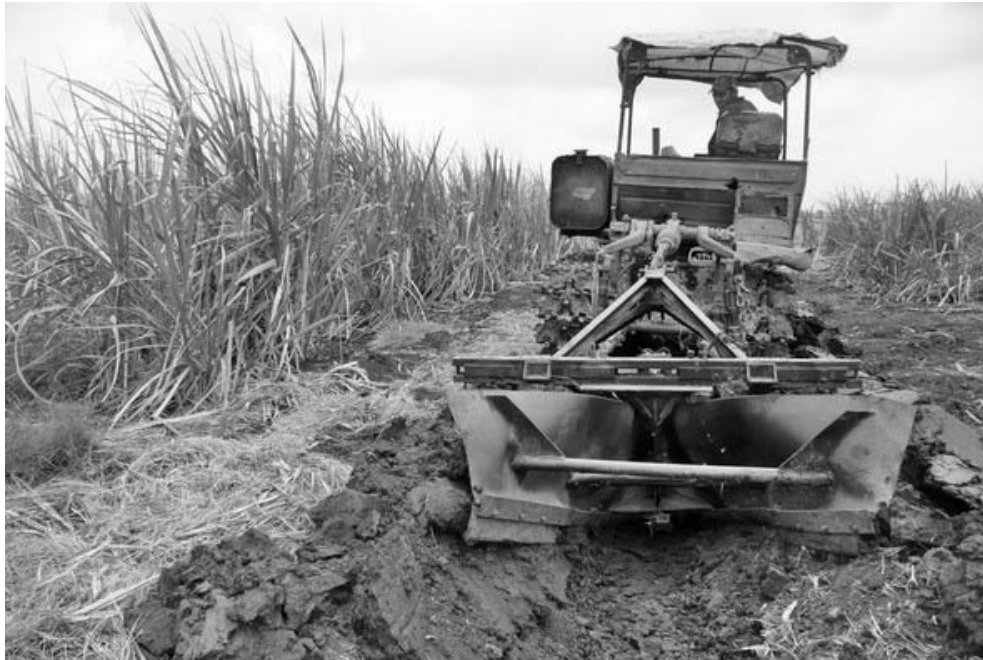
Ahora hay más control sobre las faenas y la maquinaria.

cumplen los cooperativistas y hacer más productivas las jornadas, dan mayor empleo a los subsoladores con el fin de descompactar los terrenos, una actividad que fue relegada por descuidos.