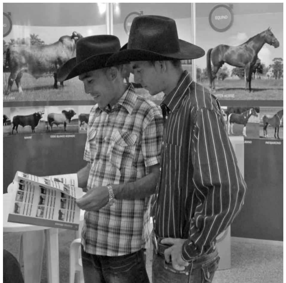
En cada edición de la feria los jóvenes ganan en participación.